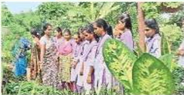
చీడిగలో నర్తరీని పరిశీలిస్తున్న విద్యార్థినులు