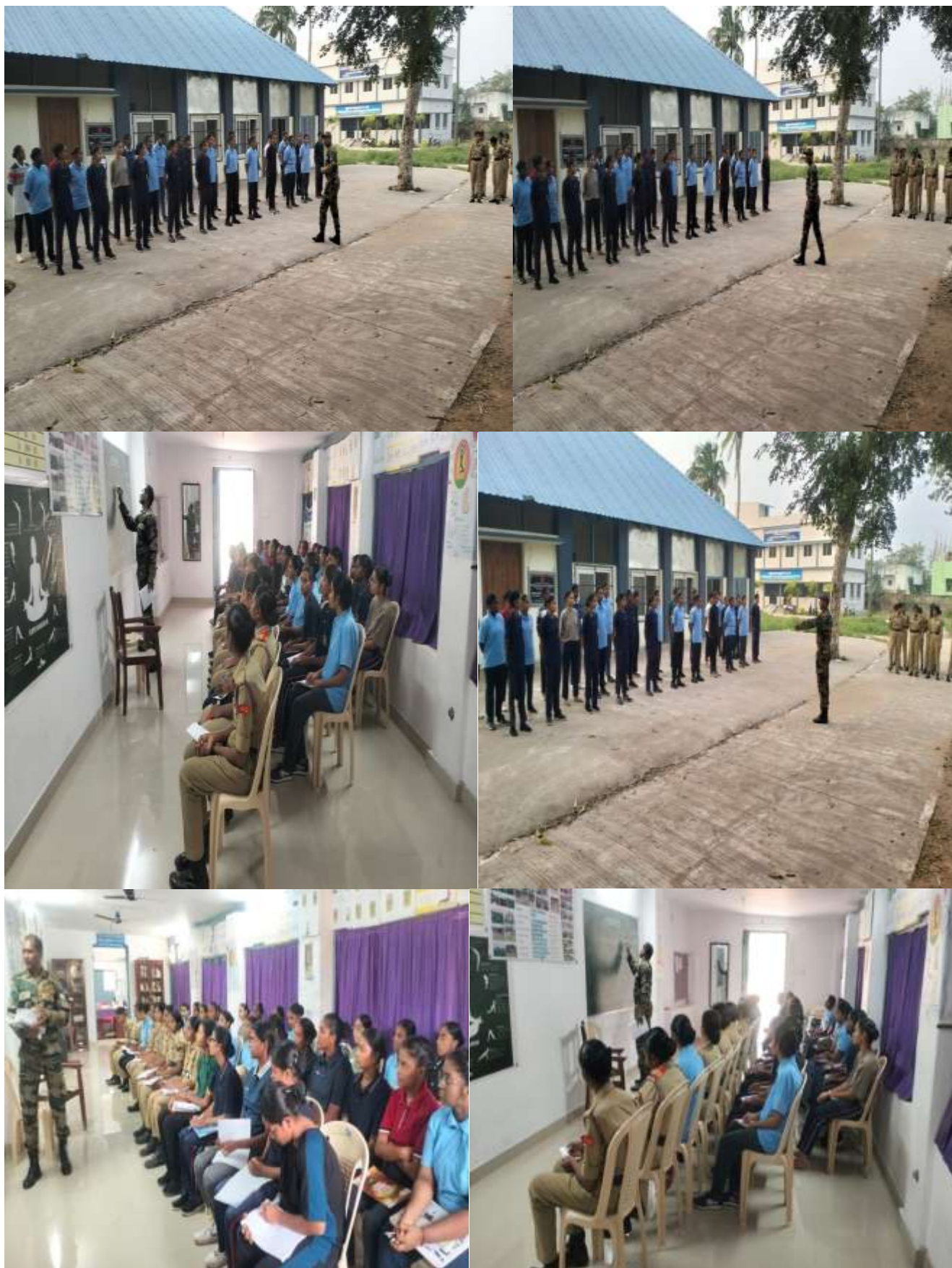
NCC class was conducted to the newly recruited Cadets