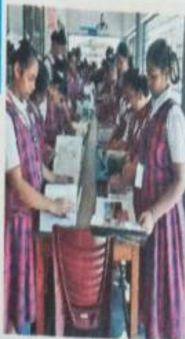
ప్రదర్శనలో పుస్తకాలు చదువుతున్న విద్యార్థినులు

హన ర్యాలీ నిర్వహించారు. విద్యార్థినులకు పోస్టర్ ప్రకటనలతోపాటు వ్యాసరచన, క్వీజ్ తదితర పోటీలు నిర్వహించారు. ఆరుదైన వాటిలో పాటు మొత్తం 400 పుస్తకాలకు పైగా ఇక్కడ ఉన్నాయి. వాటిని పలు పాఠశాలలకు సుంచి విద్యార్థులు వచ్చి తీలకంచి, వాటిలో విశేషాలను తెలుసుకుంటున్నారు.