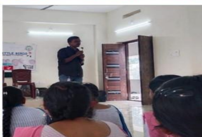
Workshop on Personal Safety Education