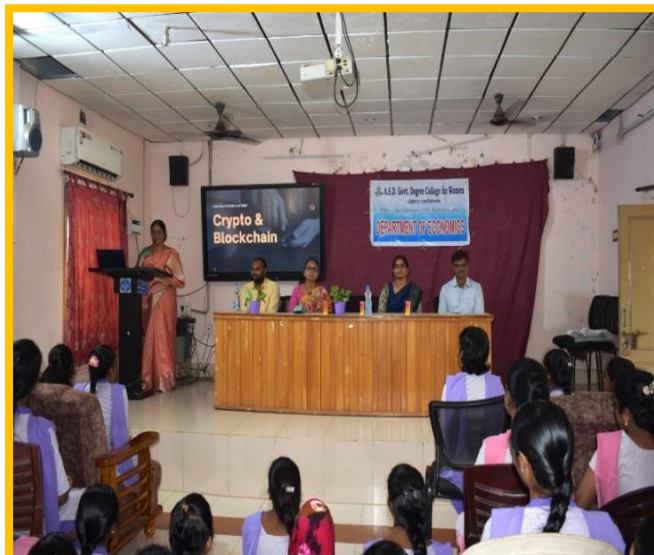
Guest Lecture on Crypto & Blockchain