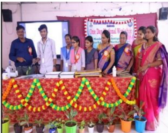
National Workshop on 'Modern Techniques in Herbarium Methodology' by the Department of Botany and Horticulture