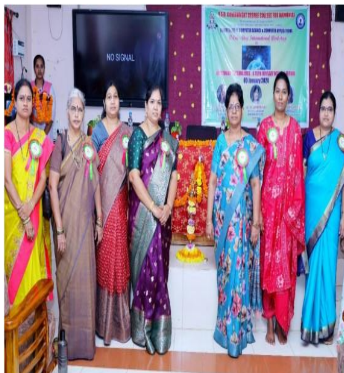
International Workshop on 'Redefining 'A Tech Odyssey in to the Future''