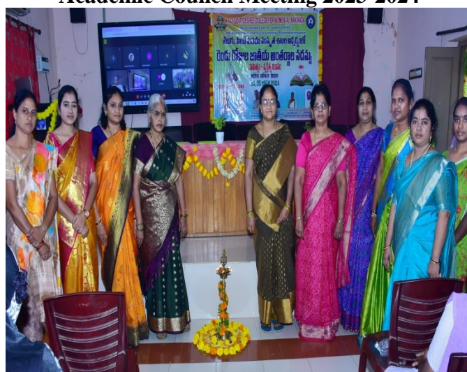
National Seminar of Telugu, Sanskrit & Hindi