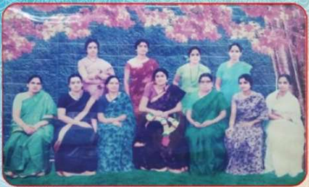
FOUNDERS OF THE COLLEGE