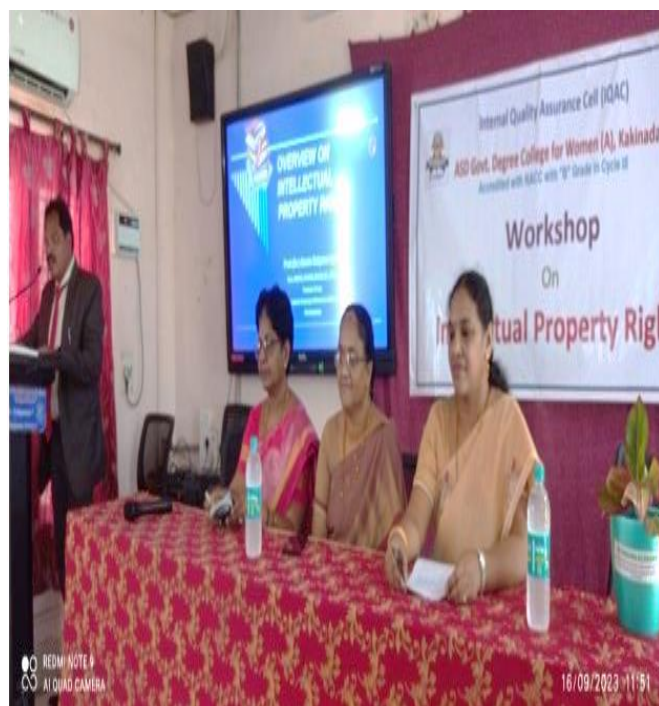
Workshop on Intellectual Property Rights Possibilities