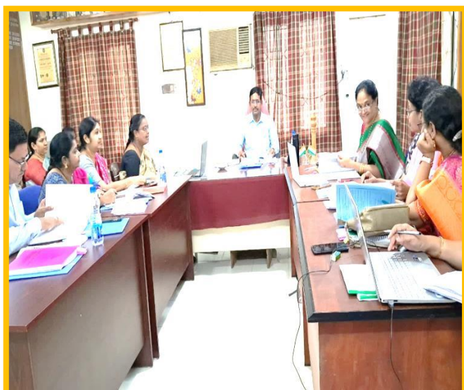
Academic Council Meeting 2023-2024