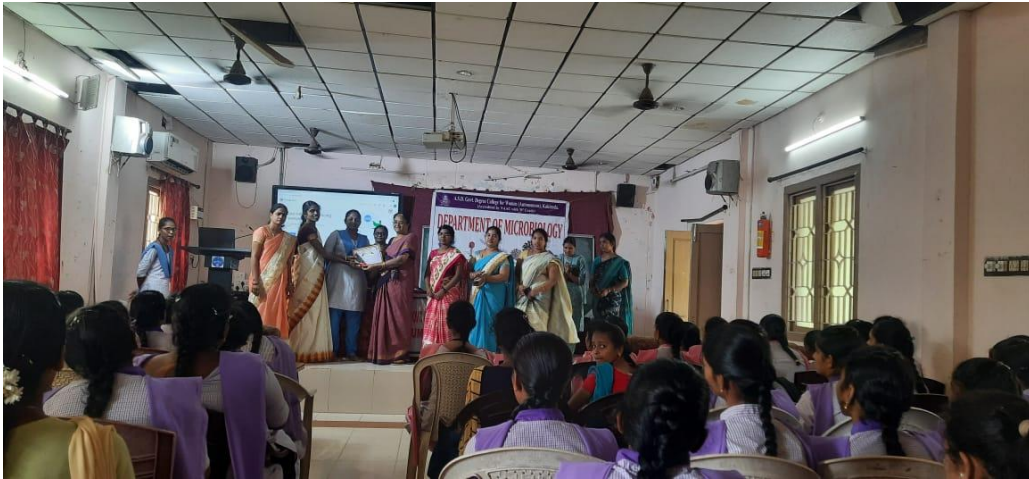
Prize distribution to winners of Essay writing competition