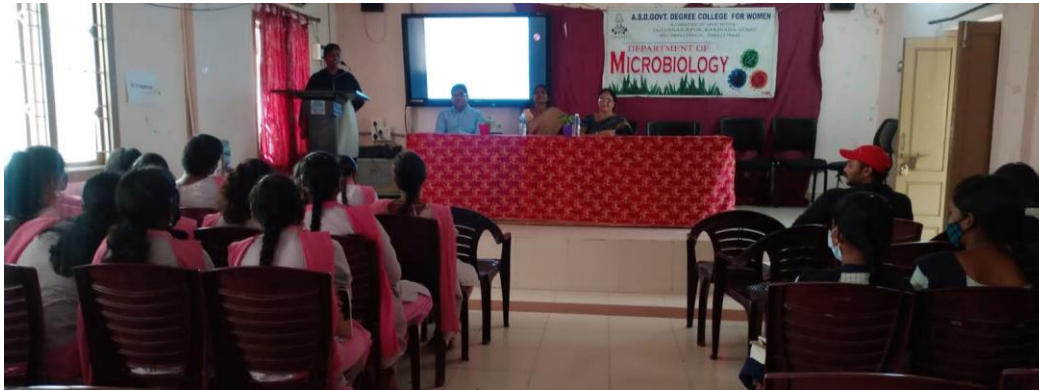
Student Feedback on the session