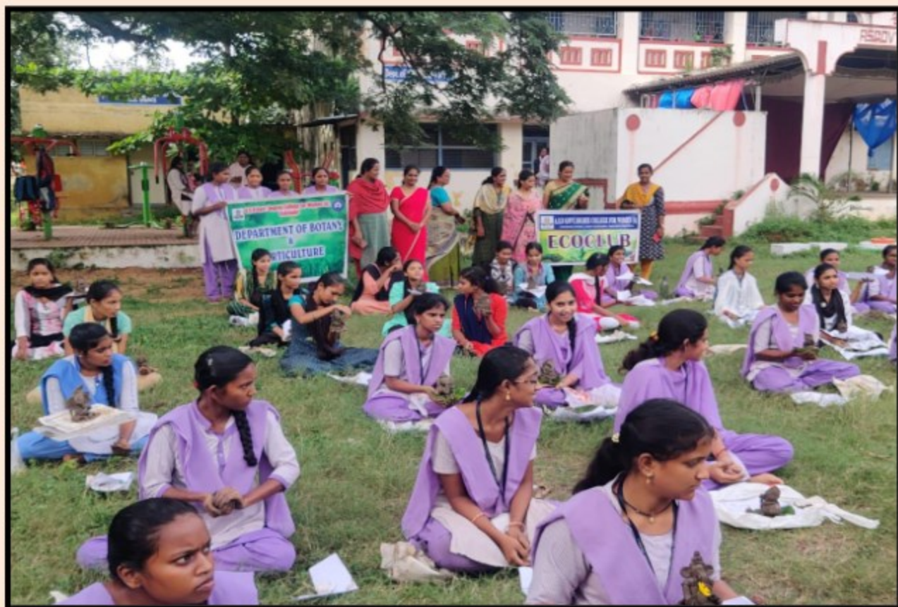
Eco club in association with Bala Ganesh Computer Training Centre and Department of Botany & Horticulture conducted Eco-friendly Ganesh Idol making competition to our students