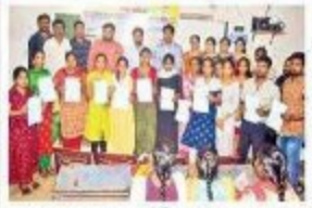
ఎంపికైన అభ్యర్థులతో వీడి, ప్రెస్సిపల్ తదితరులు