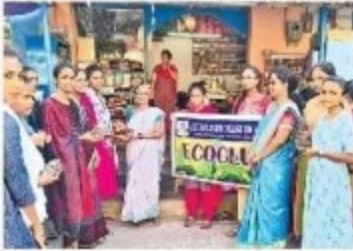
మట్టి విగ్రహాలను పంపిణీ చేస్తున్న విద్యార్థినులు

సొంబమూర్తి నగర్ (తాకినాడ), న్యూస్ టుడే: నగరంలో వినాయక చవితి సందడి మొదలైంది. పండగలు, సంప్రదాయాల పరిరక్షణలో పాటు సామాజిక బాధ్యతను కూడా తీసుకోవాల్సిన అవశ్యకతను విద్యార్థులు చాటి చెబుతున్నారు. వివిధ రసాయనాలు, ప్లాస్టర్ ఆఫ్ పారిస్ తో తయారయ్యే విగ్రహాలతో కాలుష్యం పాటు పర్యావరణానికి ముప్పు వాటిల్లుతుందని, వర్షావరణాన్ని పరిరక్షించి బివివ్యక్త తరాలకు ఆరోగ్యకర, ఆందమైన