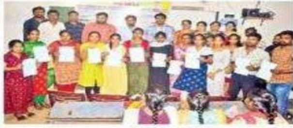
ఎంపికైన అభ్యర్థులతో పీడీ, ప్రిన్సిపల్ తదితరులు