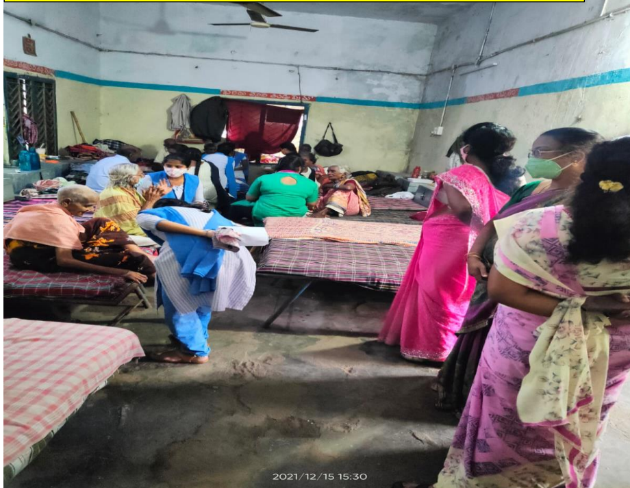
Students of Botany Interacting with Women at Janavali Old age home