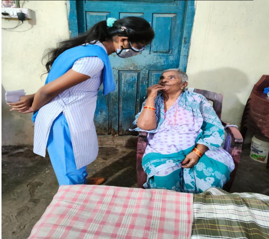
Department of botany Old Age Home Visit on 15- 12-2021