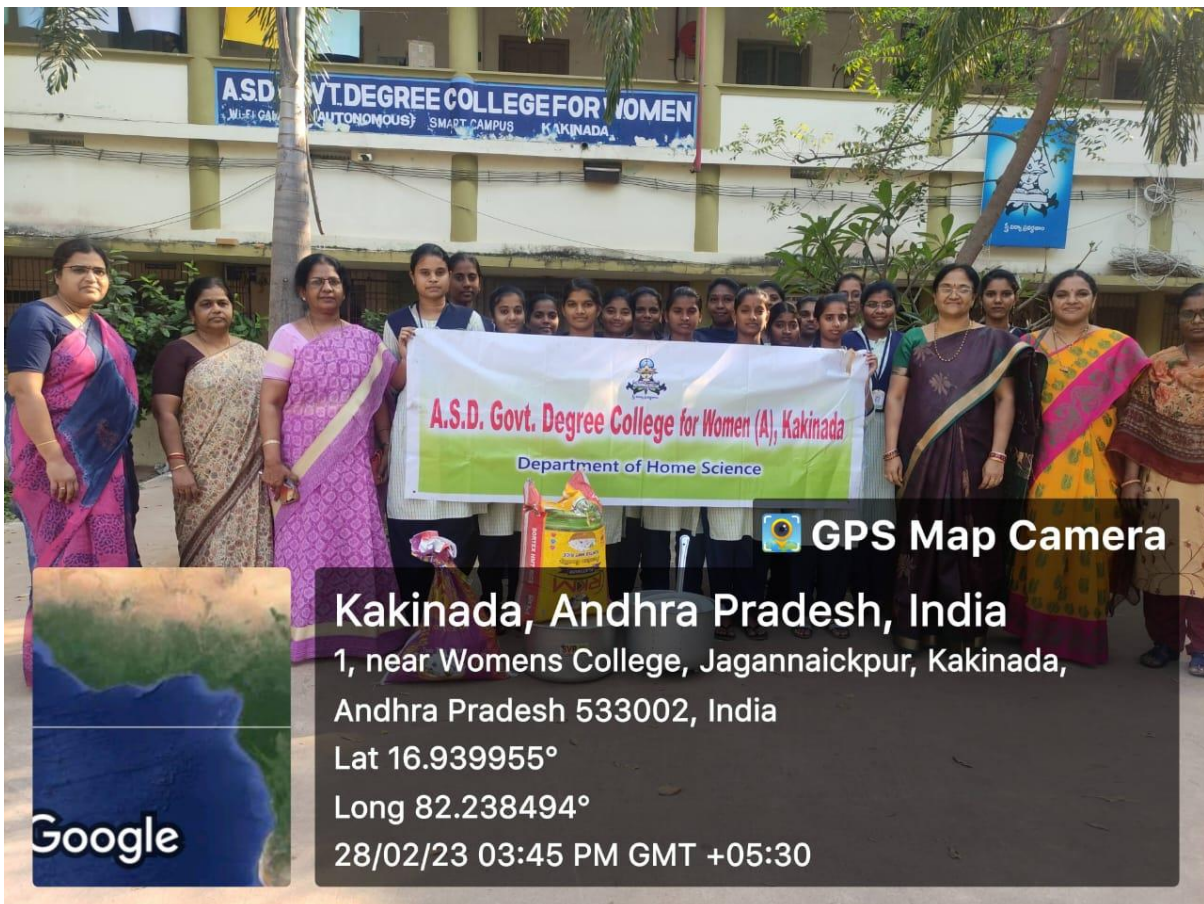
Donating of vessels to Janavali old Age home by Home Science Department on 28/02/2023