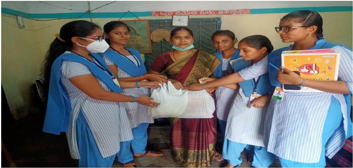
Department of Home Science students visits to Janavali Old age Home