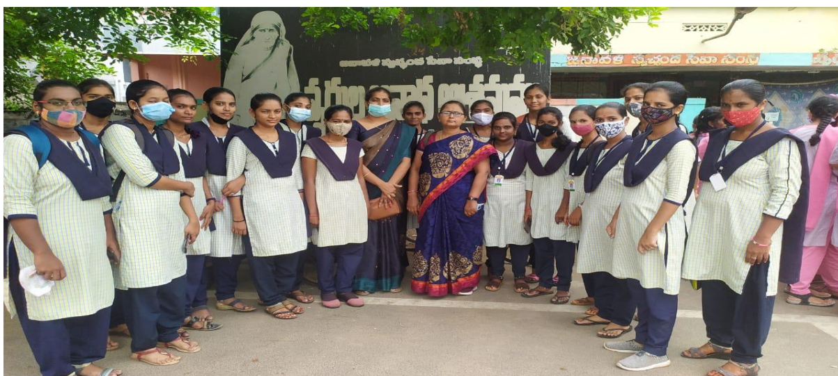
Students of BA at Janavali old age home.