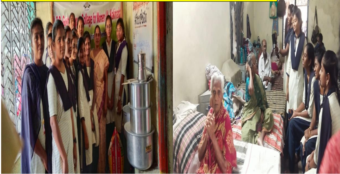
Students of Home Science Interacting with Women at Janavali Old age home.

Department of Home Science Old Age Home Visit on 28-02-2023