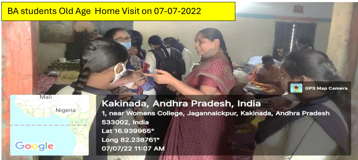
BA students Old Age Home Visit on 07-07-2022