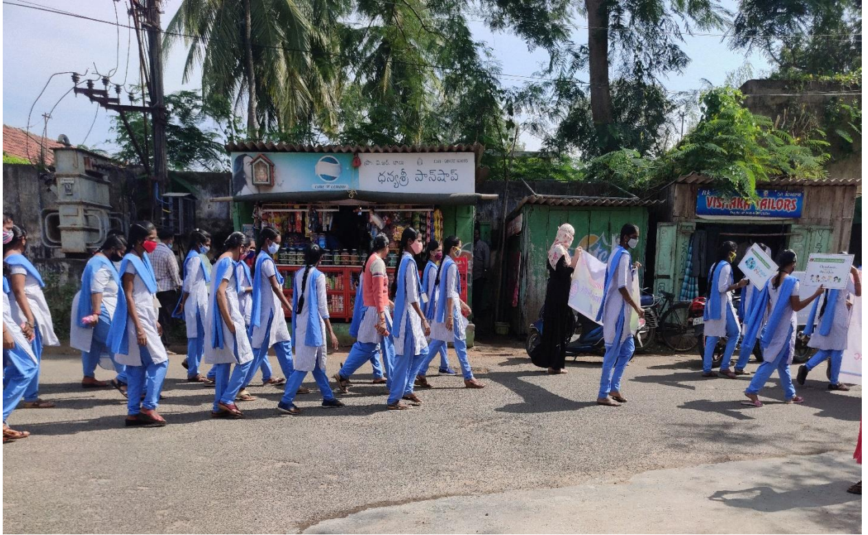
Students of ASD Govt Degree College, Creating Awareness on soil conservation with placards at Etimoga