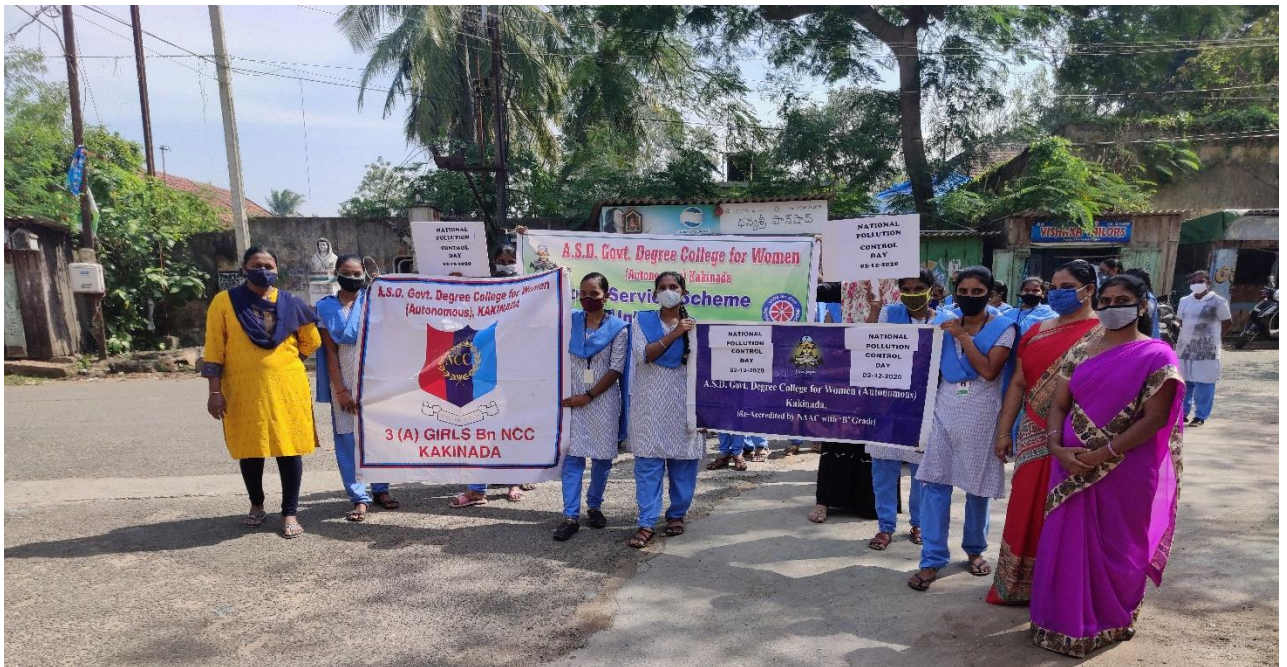
NSS Volunteers Creating Awareness on pollution with Placards in the streets of Jaganaaickpur