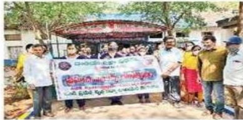
ఎయిడ్స్ పై ర్యాలీ నిర్వహిస్తున్న పీఆర్ వృత్తి విద్యా కళాశాల విద్యార్థులు, అధ్యాపకులు