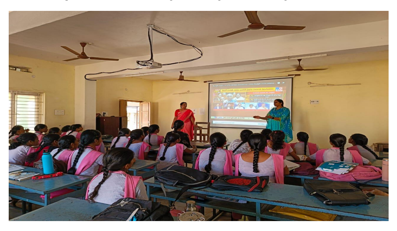
All the staff members of A.S.D GDC (W) (A), attended the AI tools workshop through Online