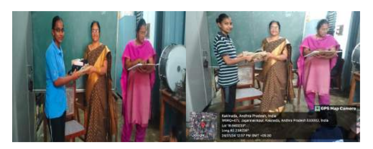
REPUBLIC DAY CELEBRATIONS IN OUR COLLEGE