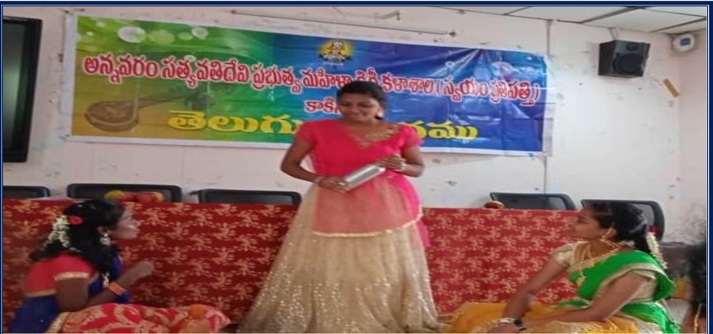
Skit on The Importance of Telugu Language and Culture