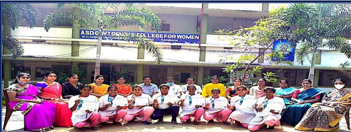
1 KUDO East Godavari District Tournament with ASD Staff