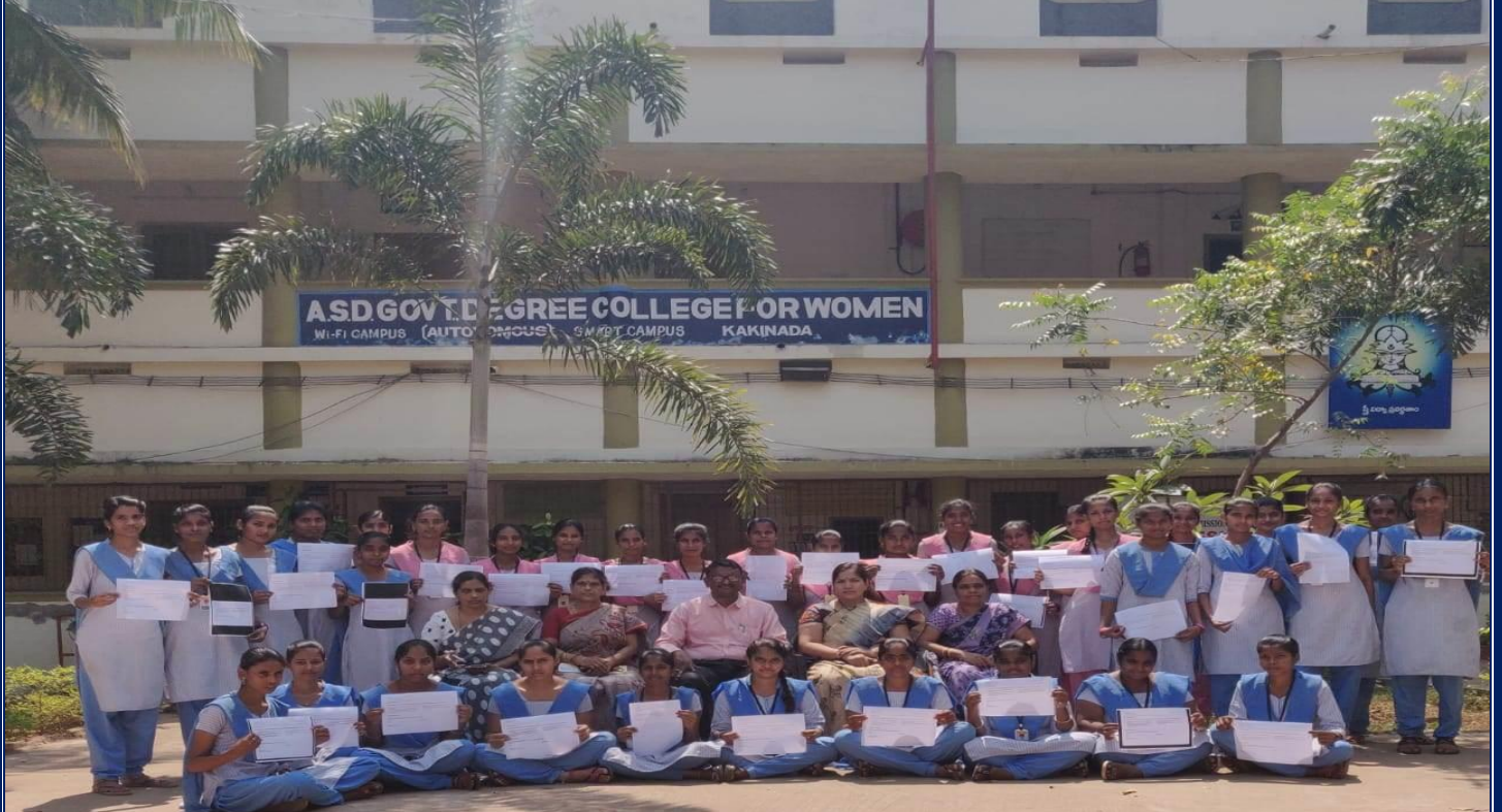
41 Students of II & III B. Com (CA) received the Course Completion Certificates from CISCO