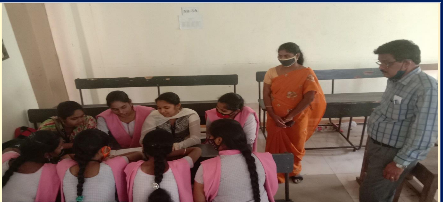
III MPCs students in GD on Physics Topics on 08.02.2021