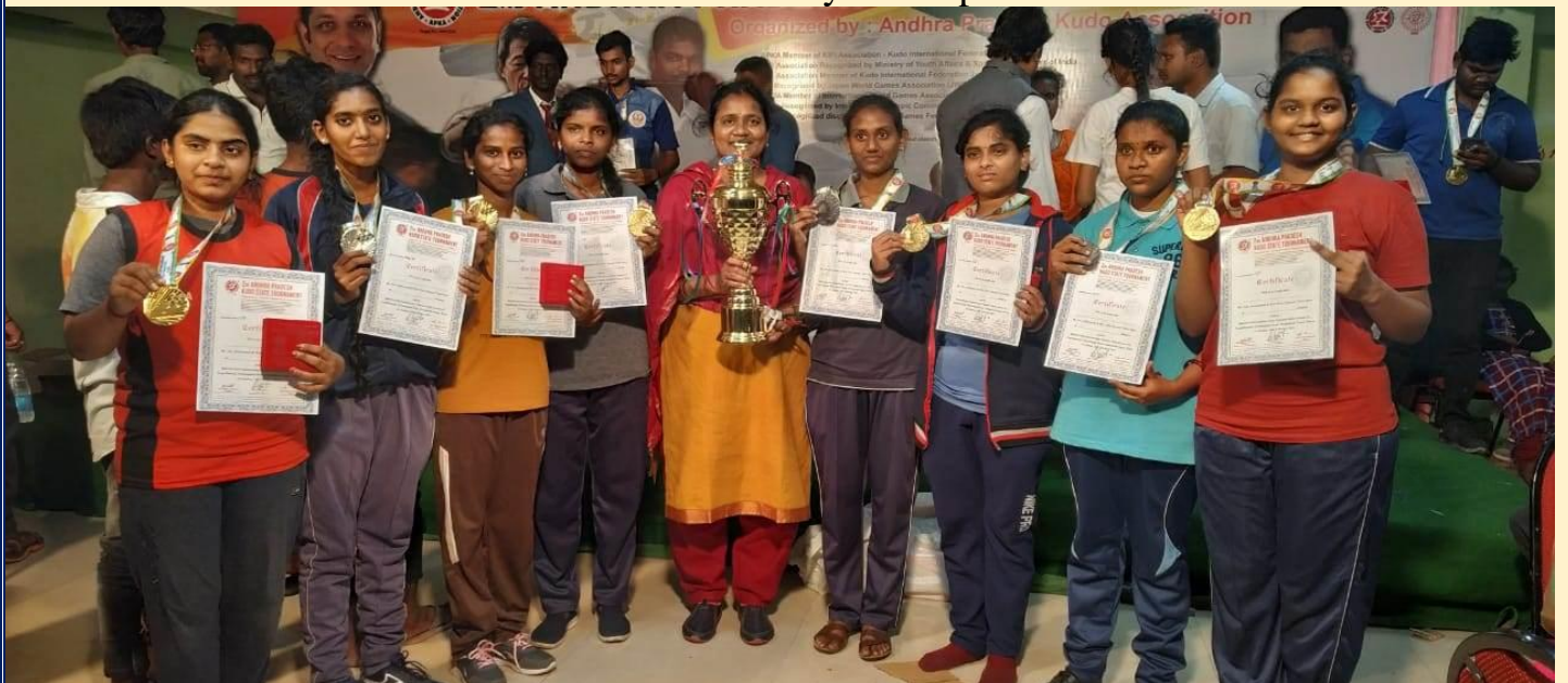
Flying Colours of ASD KUDO Team after the State Level KUDO Tournament