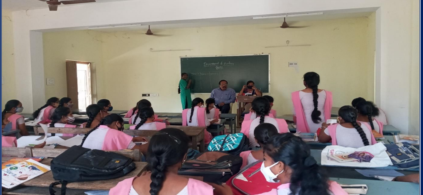
Department of Zoology conducted a Quiz Programme for III Year students