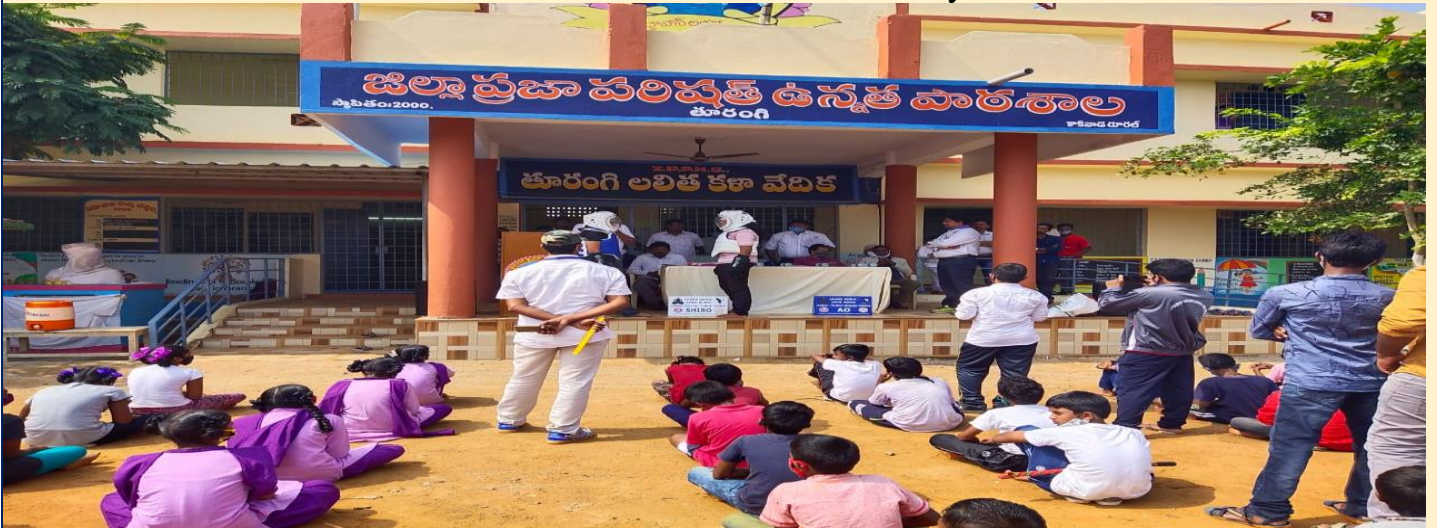
District Level KUDO at Turangi, E. G. District