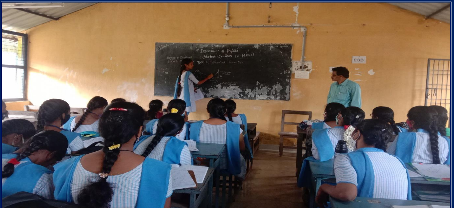
Physics Class Seminar on 20.02.2021