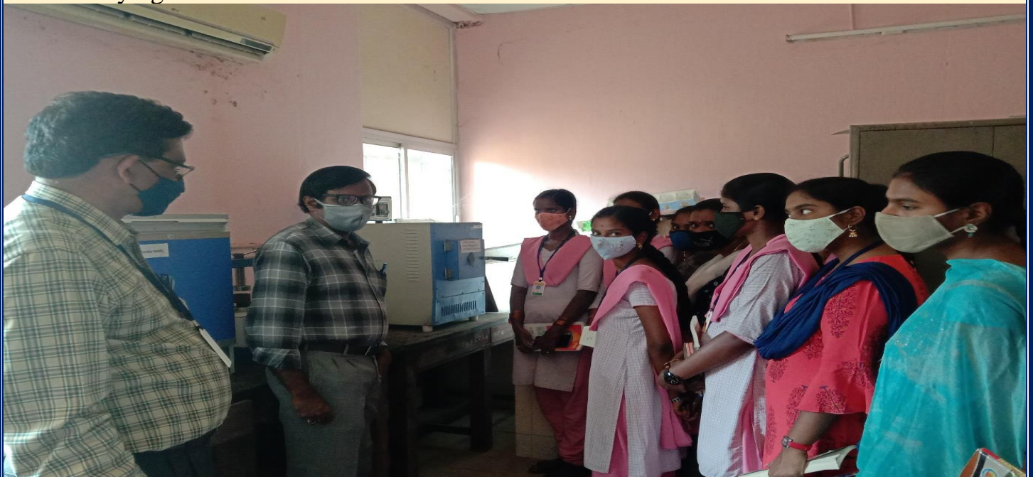
Equipment demonstration at the Meteorological Observatory, GOI, Kakinada