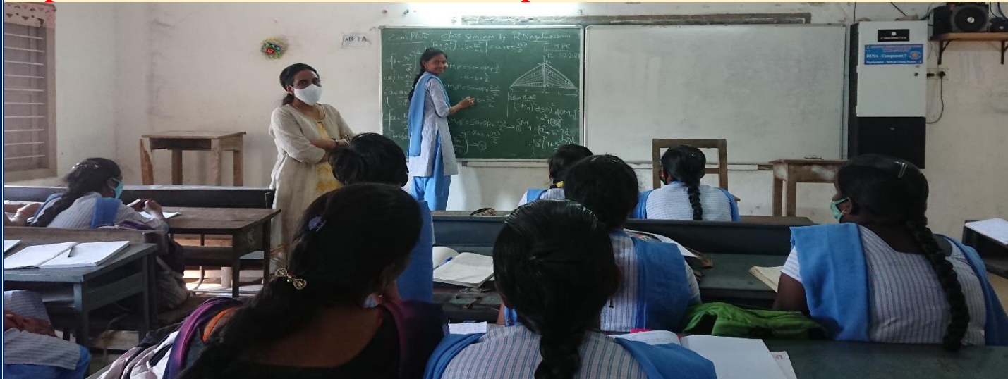
"Zone Plate" by students of II MPC/MPCS on 12.02.2021