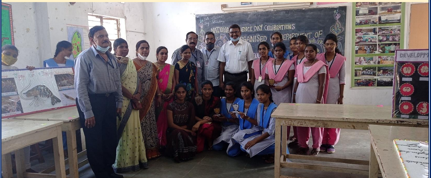
The Principal and Staff with Model Presentations Team