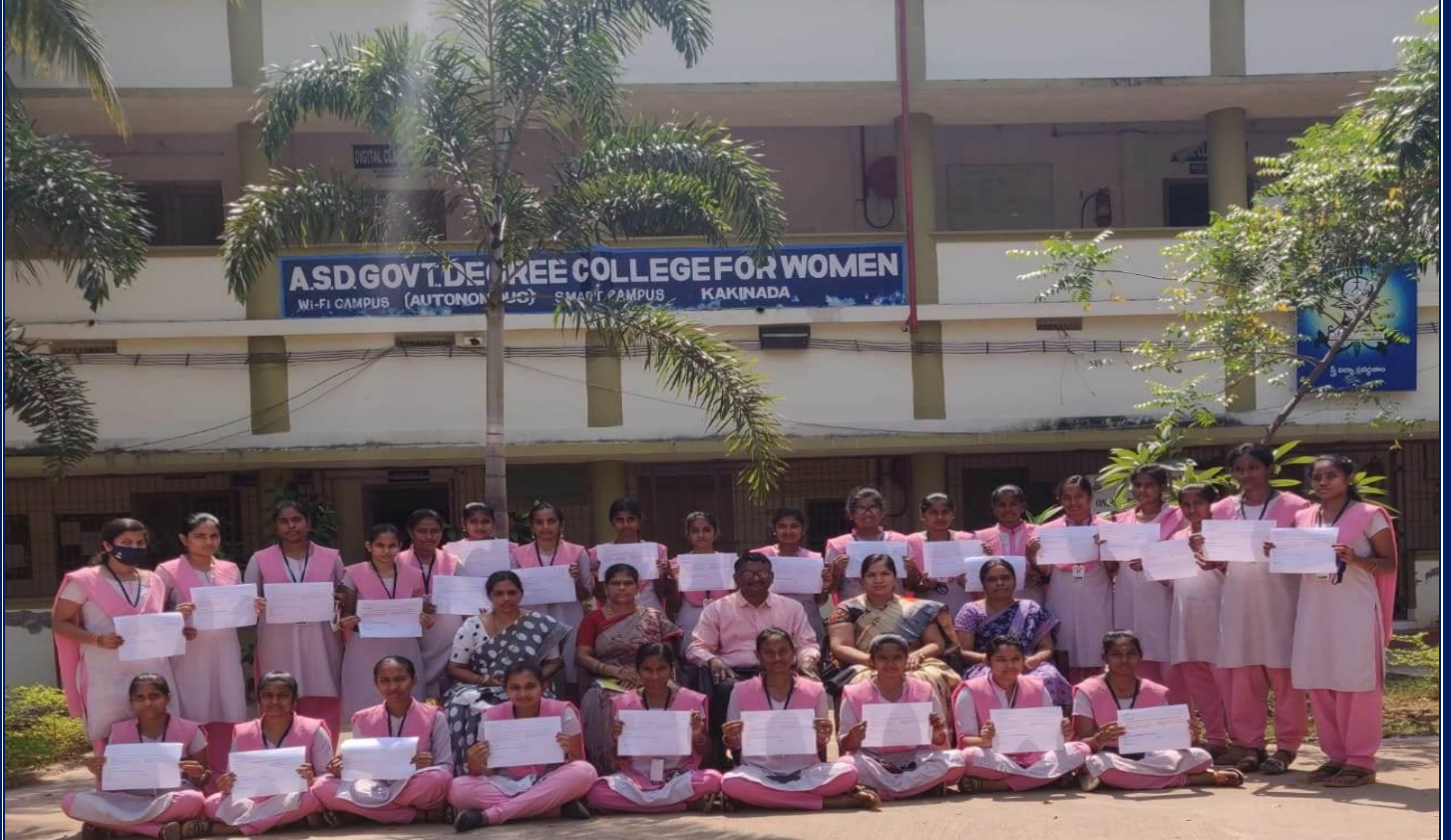
29 students from III B. Sc MPCS received the Course Completion Certificates from CISCO