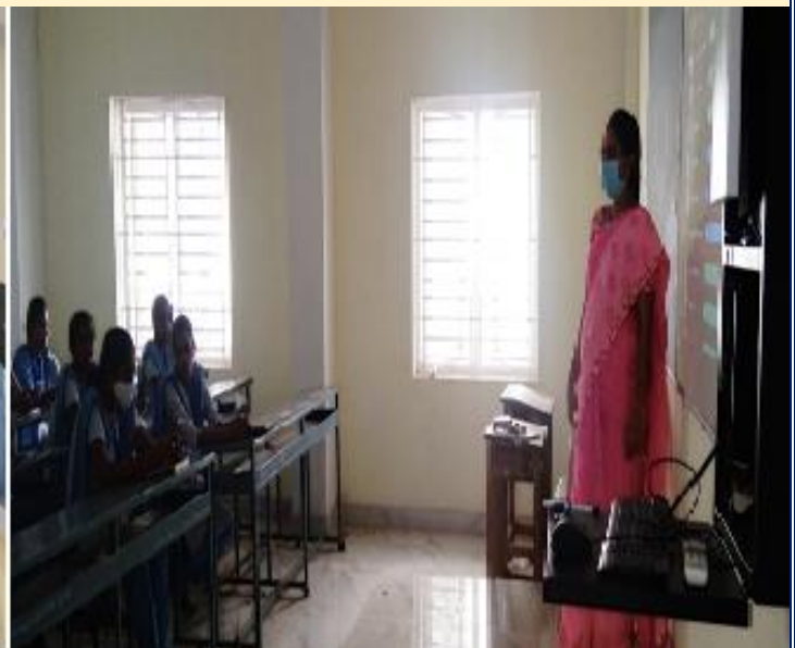
Online Quizzes using Quizizz