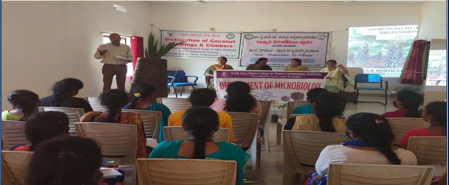
Exposure visit to HRS Pandirimamidi by the Dept. of Microbiology