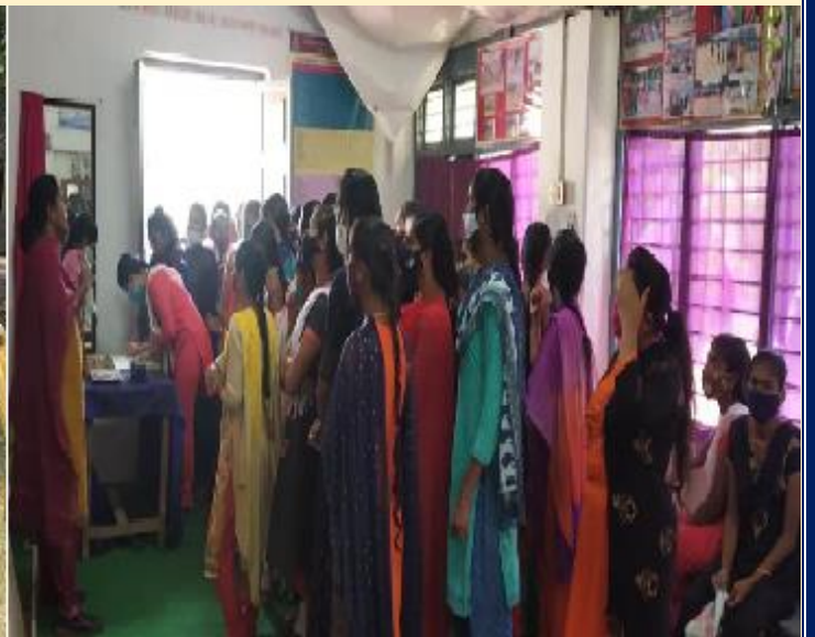
Freshers' involvement in Agility Training