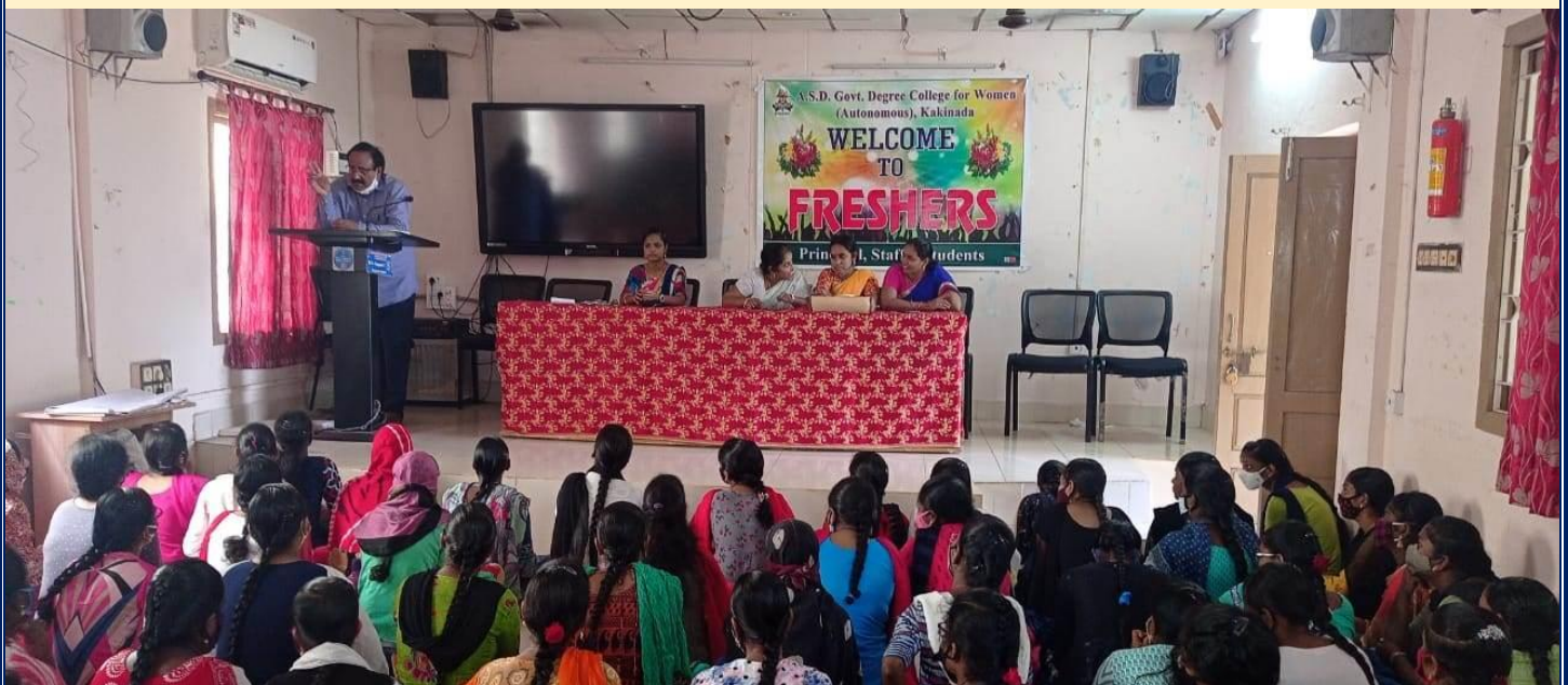
Department of Zoology in I Year Orientation Programme