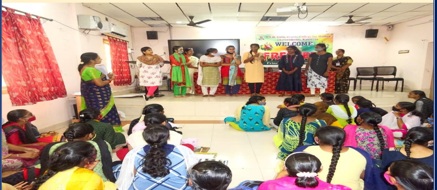
Group Activity: Things & Their Point of View was conducted for Freshers on 05.02.2021