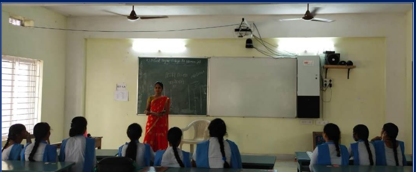
Quiz by Dept. of Hindi on 19.02 2020