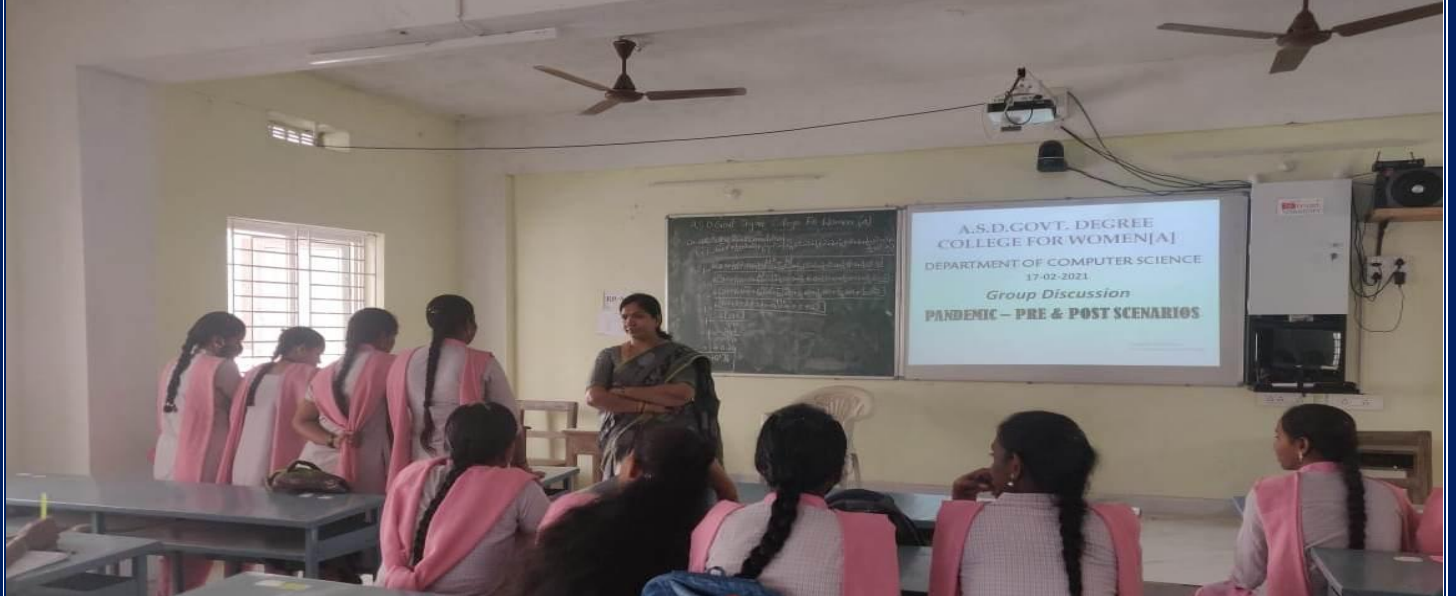
GD on Pandemic: Pre & Post Scenario for III MPCS students