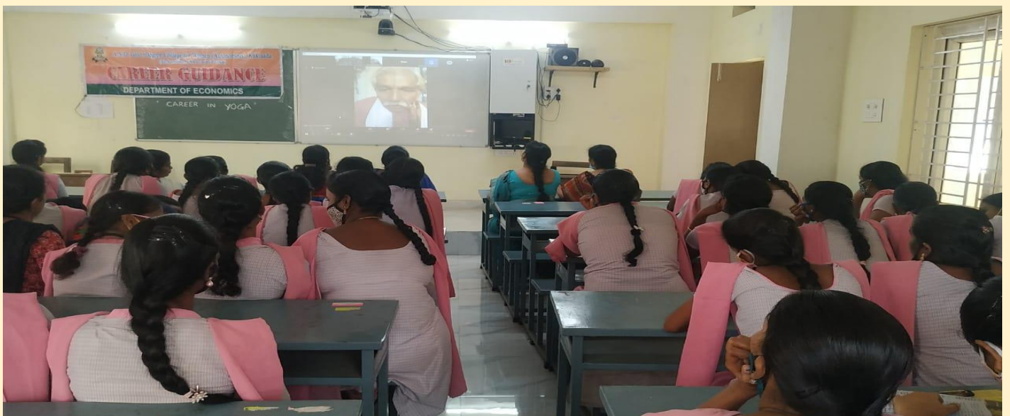
Online Career Guidance in Yoga