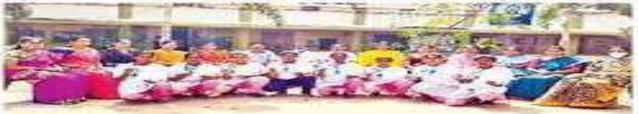
పతకాలు సాధించిన విద్యార్థినులు