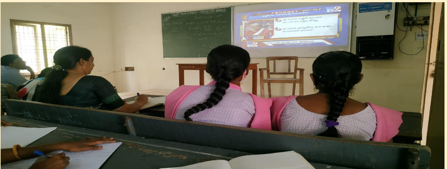
Watching Budget Release