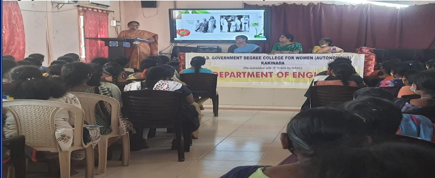
Principal sharing her insights on language acquisition through poems

On the account of the birth Anniversary of Sarojini Naidu (13 February), the Department of English conducted competitions like Poetry Recitation and PPT on Sarojini Naidu's poems, biographical details and her creative works on 14 February 2022.