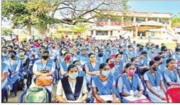
ఏఎన్డీ మహిళా కళాశాలలో సదస్సుకు పాల్గొనిన విద్యార్థులు