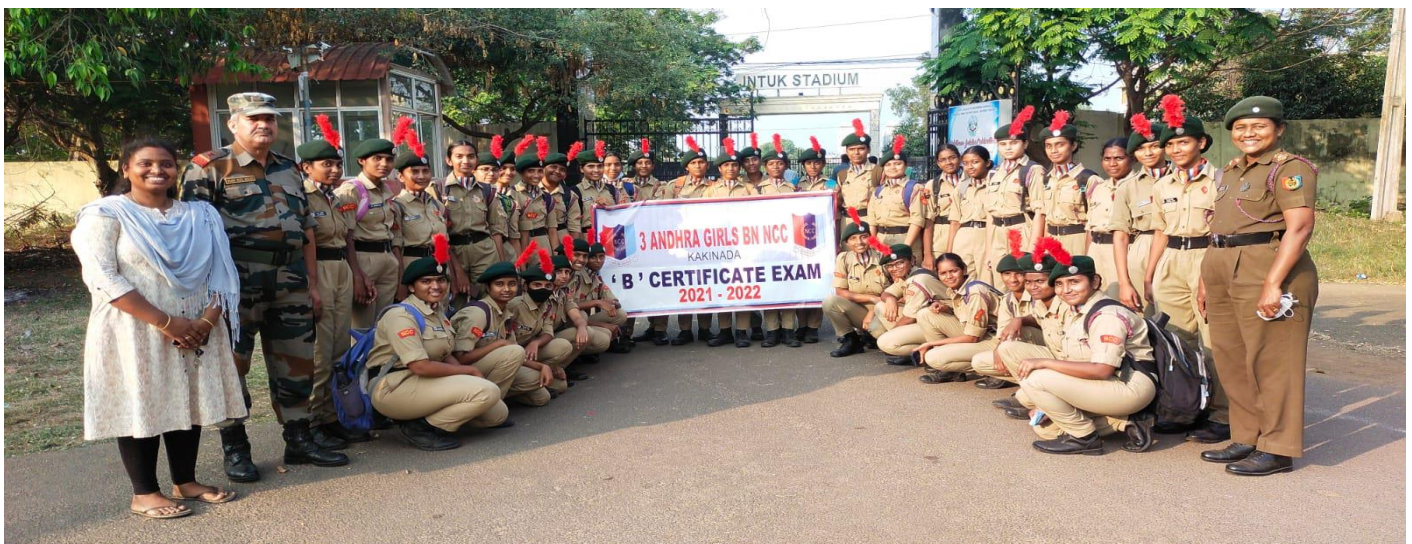
ASD NCC Team exciting to take 'B' Certificate Test