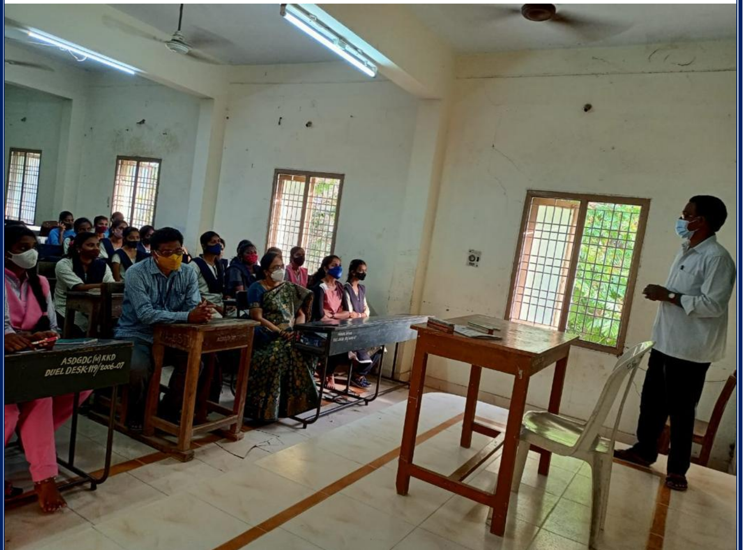
Certificate Course of Spoken English classes through JKC