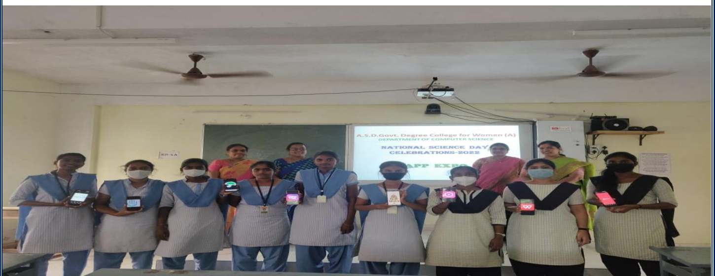
App Expo Event was also conducted on the part of National Science Day Celebrations.