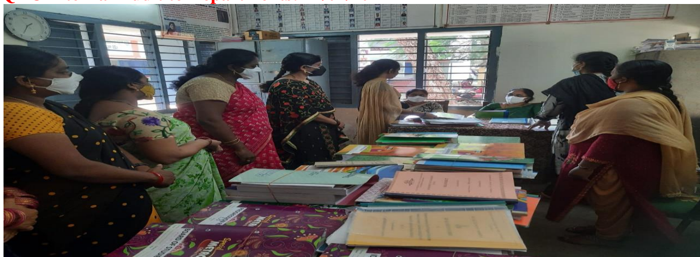
IQAC Internal Audit visiting to Department of Commerce