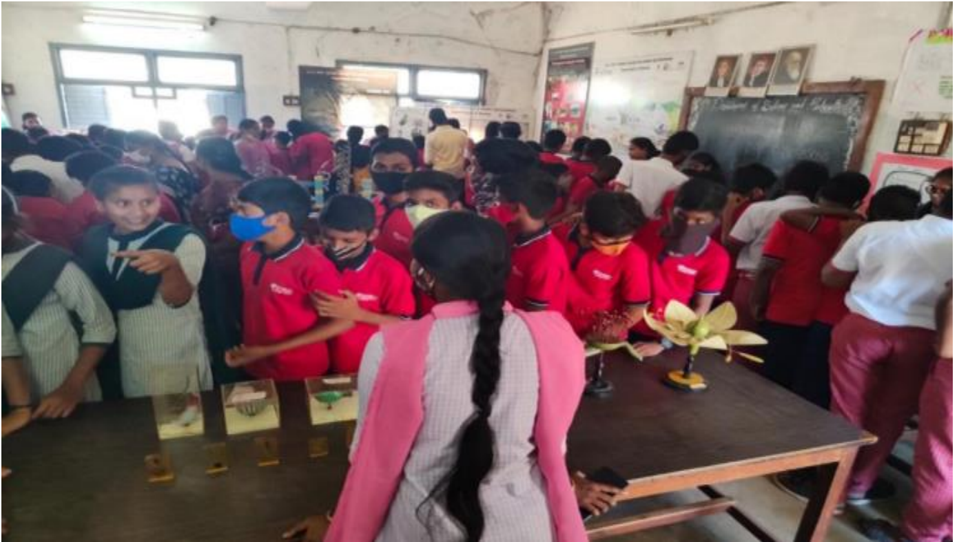
Students visiting the Exhibition of Botany Department

Intermediate Students of AS Junior College, Kakinada and Aryan Public School Kakinada visited The Science exhibition that was conducted by the Department of Botany and Horticulture. Students displayed various models and useful equipment for the Botany and Horticultural to the students in the Science Exhibition