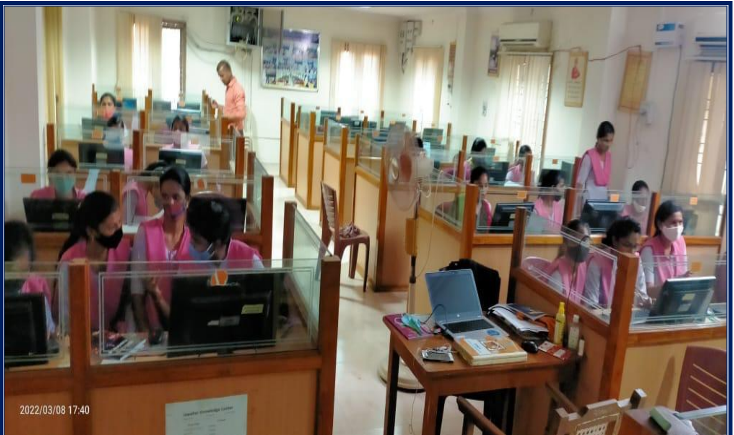
Certificate Course of C Language & HTML classes through JKC