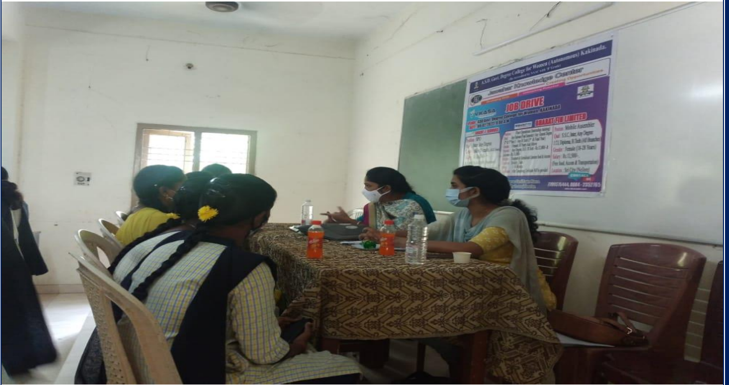
Screening Test at Job Drive