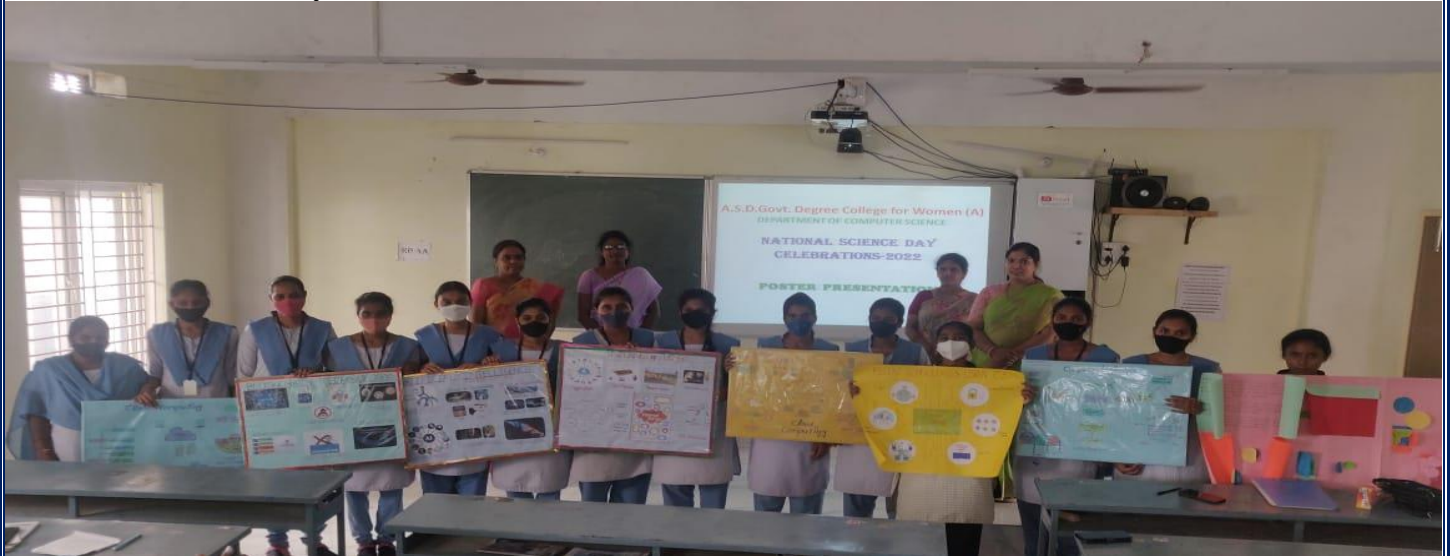
Displaying Poster Presentations with the faculty and the Judges

Department of Computer Science organized Poster Presentation Competition on the account of National Science Day Celebrations on 25/02/2022.