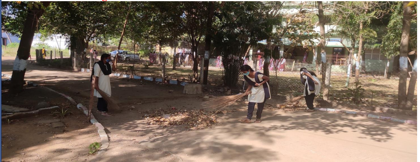
Biweekly cleaning by NSS volunteers in the campus.