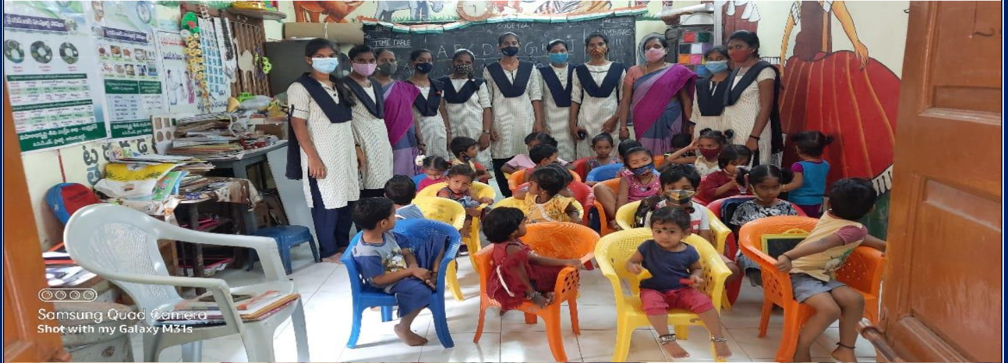
Samsung Quad Camera Shot with my Galaxy M31s

Students of II B. Sc. Home Science visited Anganwadi and conducted case studies on 07/02/2022.