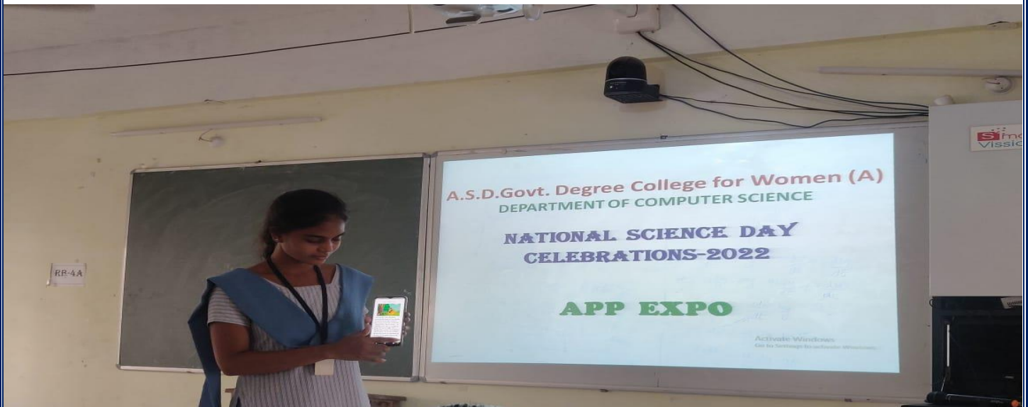
Demonstrating her App Expo