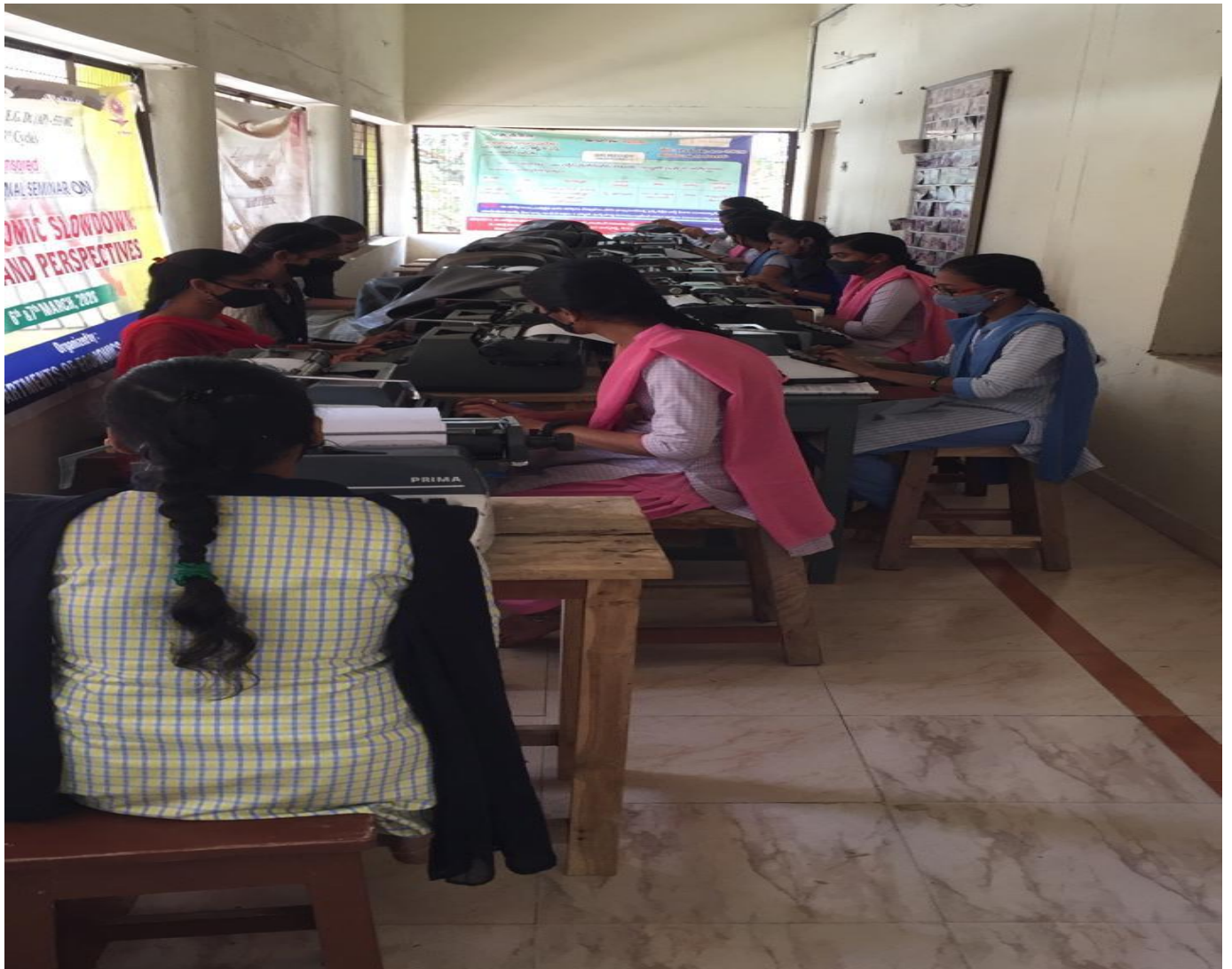
Certificate Course in Typing Skills