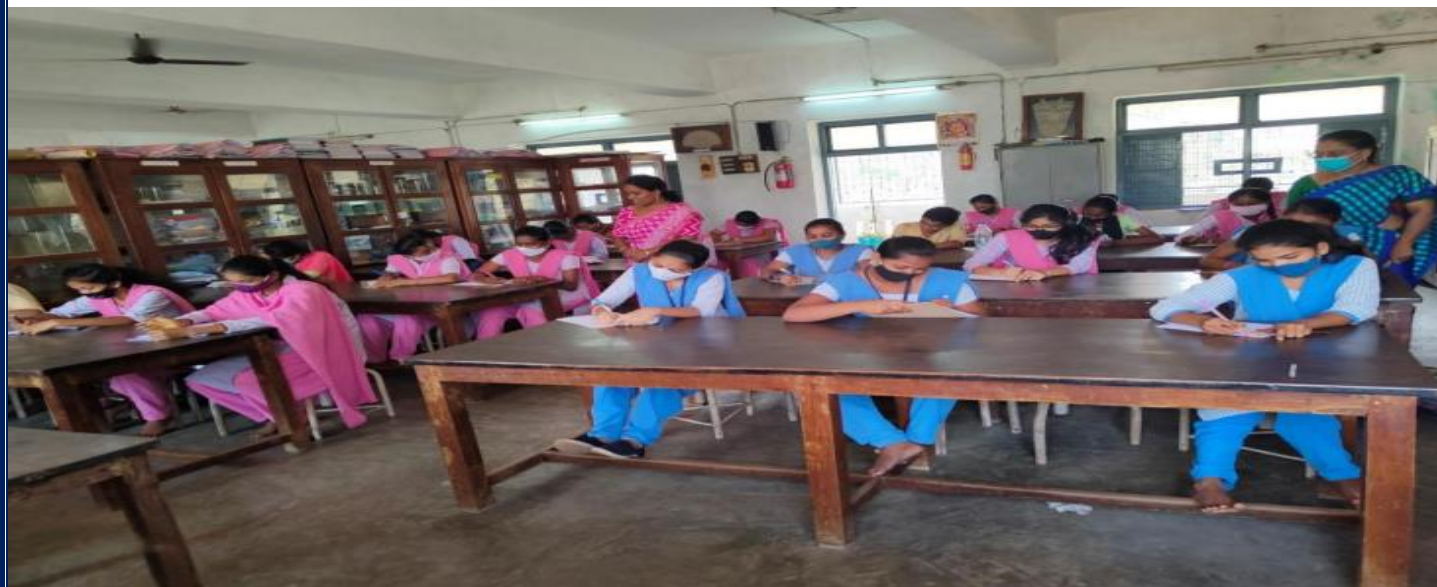
Essay Writing Competition