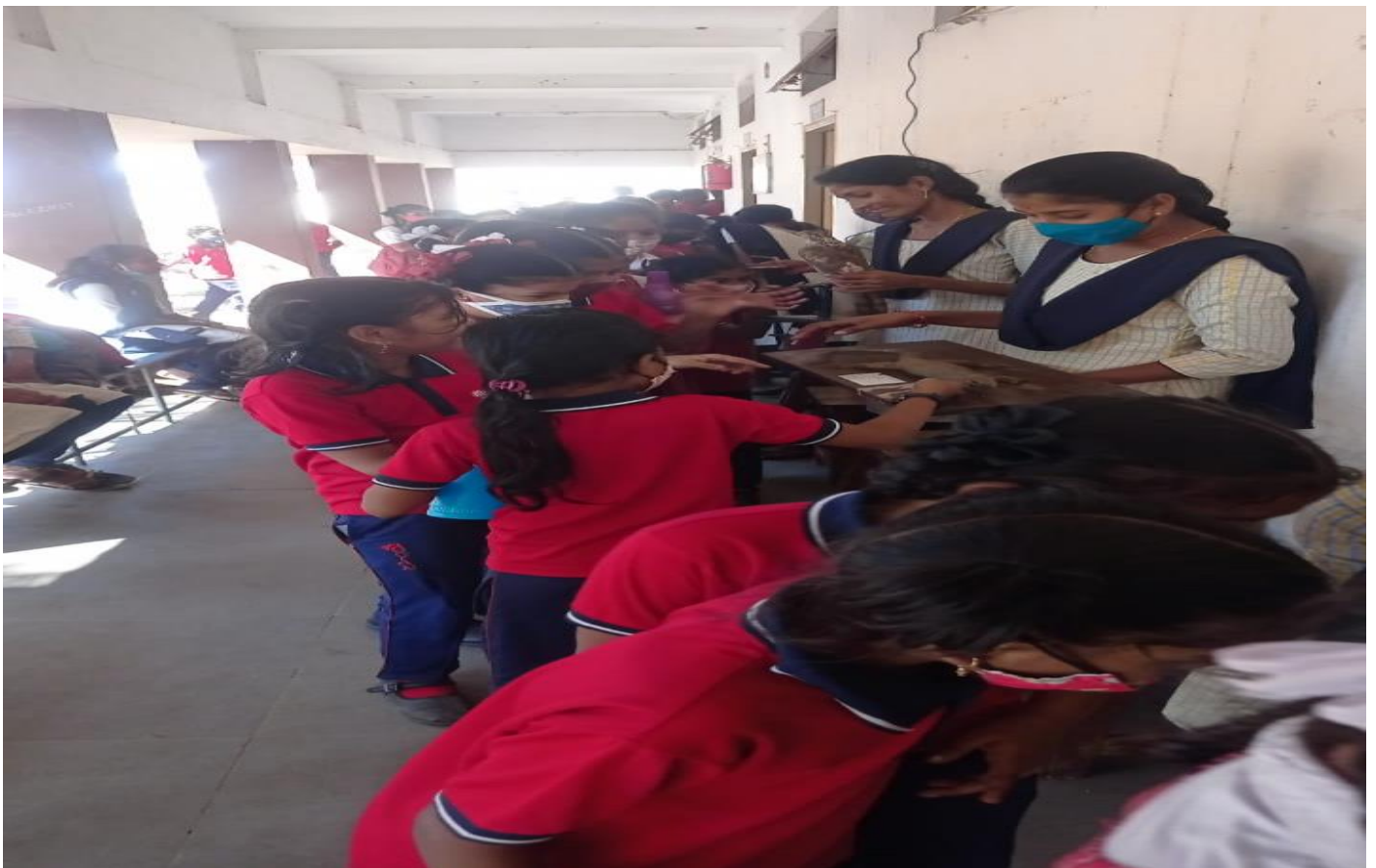
Science exhibition conducted by the Department of Zoology and Aquaculture Technology on account of National Science Day on 26/02/2022