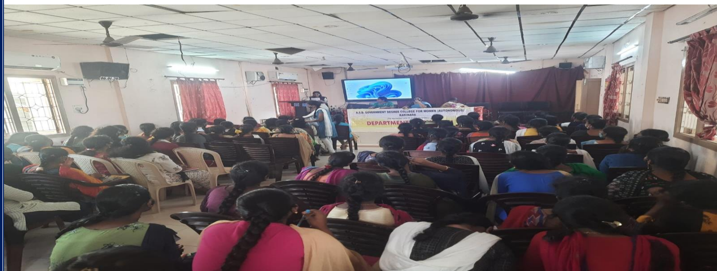
Student's recitation of the poem