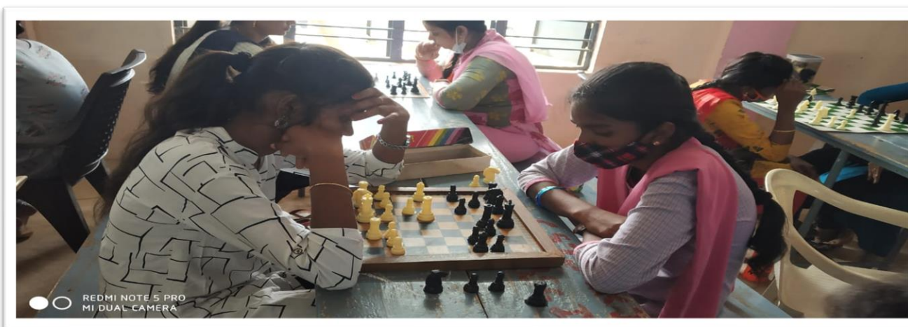
Our college chess team bagged 4th place on 24/03/2022