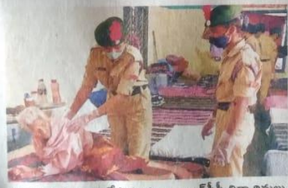
వృద్ధులకు సవర్యలు చేస్తున్న కళాశాల ఎన్సీసీ విద్యార్థినులు

పేరుకుపోయిన చెత్తను తొలగించి ఆహారకర వాతావరణానికి తోడ్పాటు అందిస్తున్నారు. నగరంలోని స్వాతంత్ర్య సమరయోధులు, దేశ నాయకుల విగ్రహాలను శుభ్రం చేయడం, బస్టాండు, టైల్స్ స్టేషన్లలో స్వచ్ఛభారత్ చేపట్టడం వంటి కార్యక్రమాలు చేపడుతున్నారు. దీర్ఘకాలిక వ్యాధులపై ప్రజలకు అవగాహన కల్పిస్తూ డ్యాలీలు చేస్తున్నారు. తాము చదువుకున్న కళాశాలను నైతం అందంగా తీర్చిదిద్ది వివిధ రకాల మొక్కలు నాటి పచ్చదనం పెంచుతున్నారు. రక్తదానం అవశ్యకతను తెలియజేస్తూ ఇంటికూ తిరుగుకూ కరపత్రాలు పంపిణీ చేస్తున్నారు.