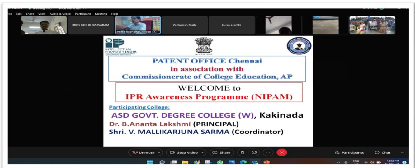
Faculty Participation in IPR Awareness Programme – 11/03/2022