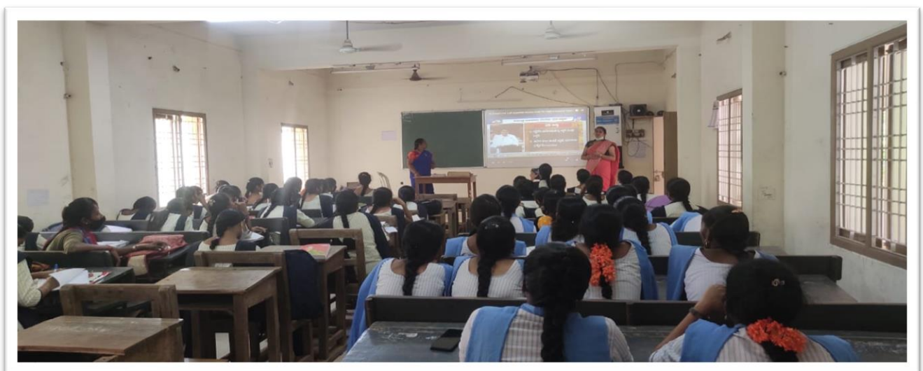
Department of Economics organised Budget Live session through Virtual Classroom for I, II & III years of BA HEP and HET students. 86 students viewed it.