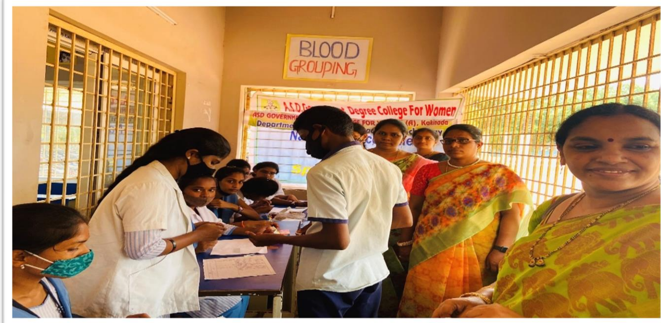
100 units of blood samples were collected in the camp for testing

Departments of Zoology and Aquaculture Technology conducted Blood Grouping for the students of Sarvepally Radha Krishnan Municipal corporation high school as a part of an Extension activity in collaboration with NSS Units of ASD Govt Degree College for Women (A), Kakinada. The objective of this programme was to inculcate the habit of community service among the students. 30 students of B. Sc. volunteered.