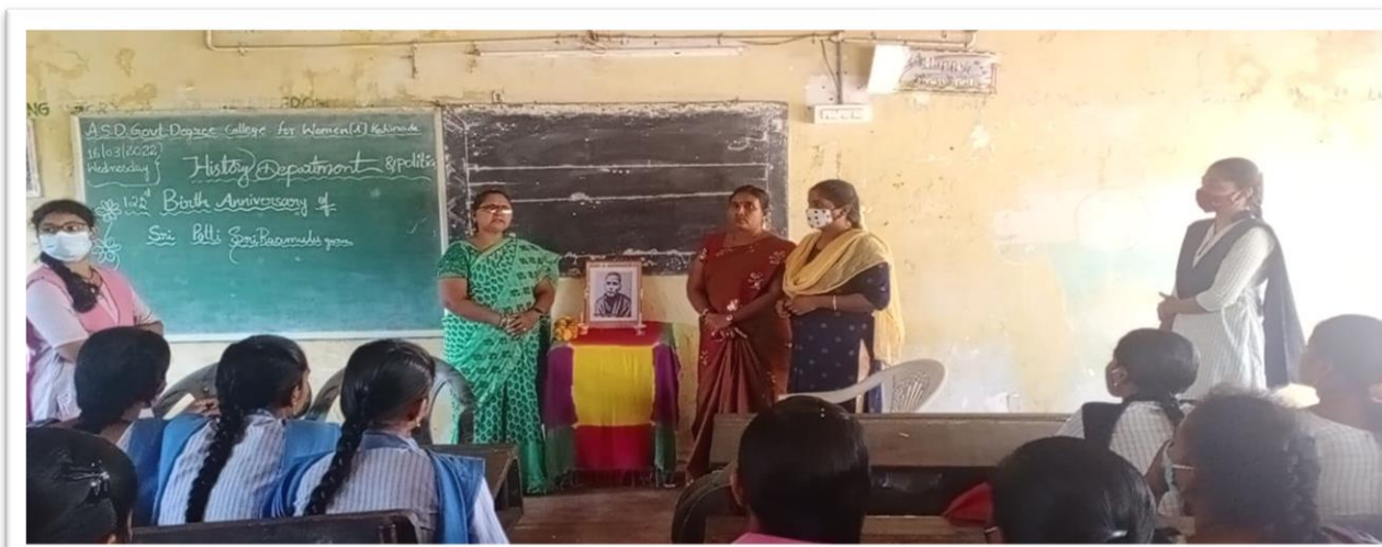
Departments of History & Political science observed Sri Potti Sri Ramulu Jayanthi – 16/03/2022.