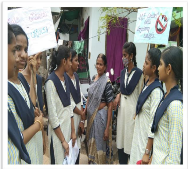
Giving awareness to the public through placards and slogans for stopping plastic use