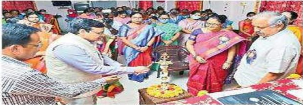
జ్యోతి వెలిగిస్తున్న ముఖ్యఅతిథులు