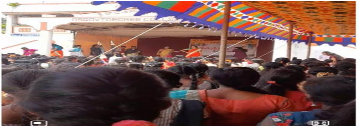
Freshers' Day celebrations at the college - 09/03/2022