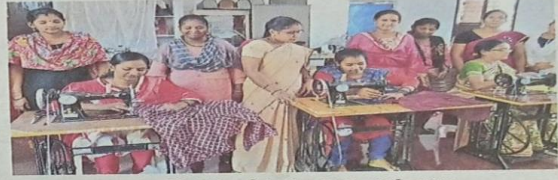
కుటుంబ శిక్షణ తీసుకుంటున్న మహిళలు