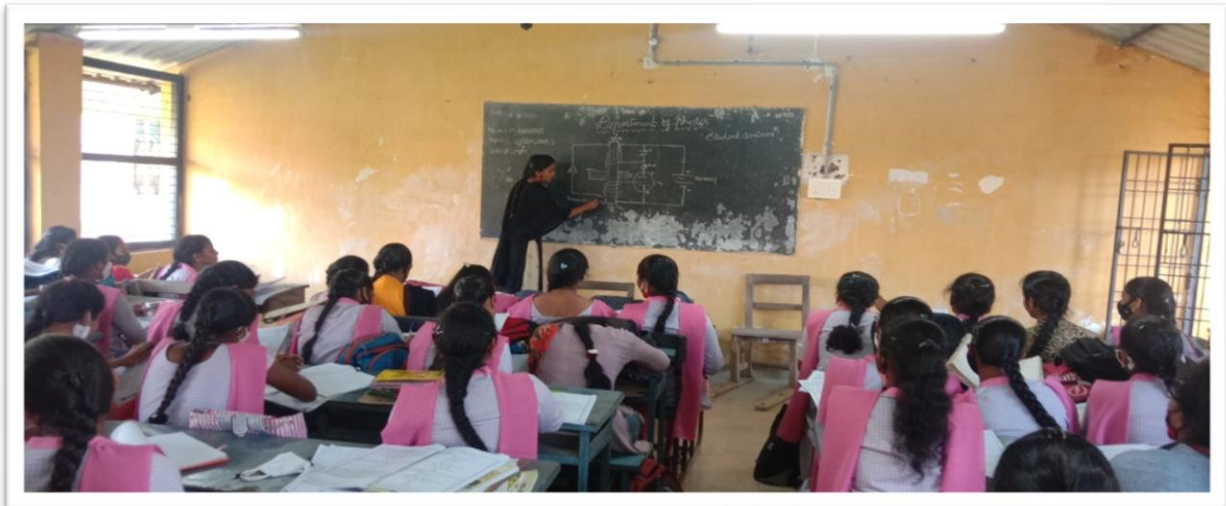
Student explaining her topic in the Seminar

Department of Physics conducted Student Seminars for I B. Sc. MPC & MPCS students on 04/03/2022 and GDs for III B. Sc. MPC & MPCS students on 23/03/2022. The topics of GD: The role of Energy in Economic & Social Development, Environmental Degradation due to Energy Production and Utilization, and Energy Flow.