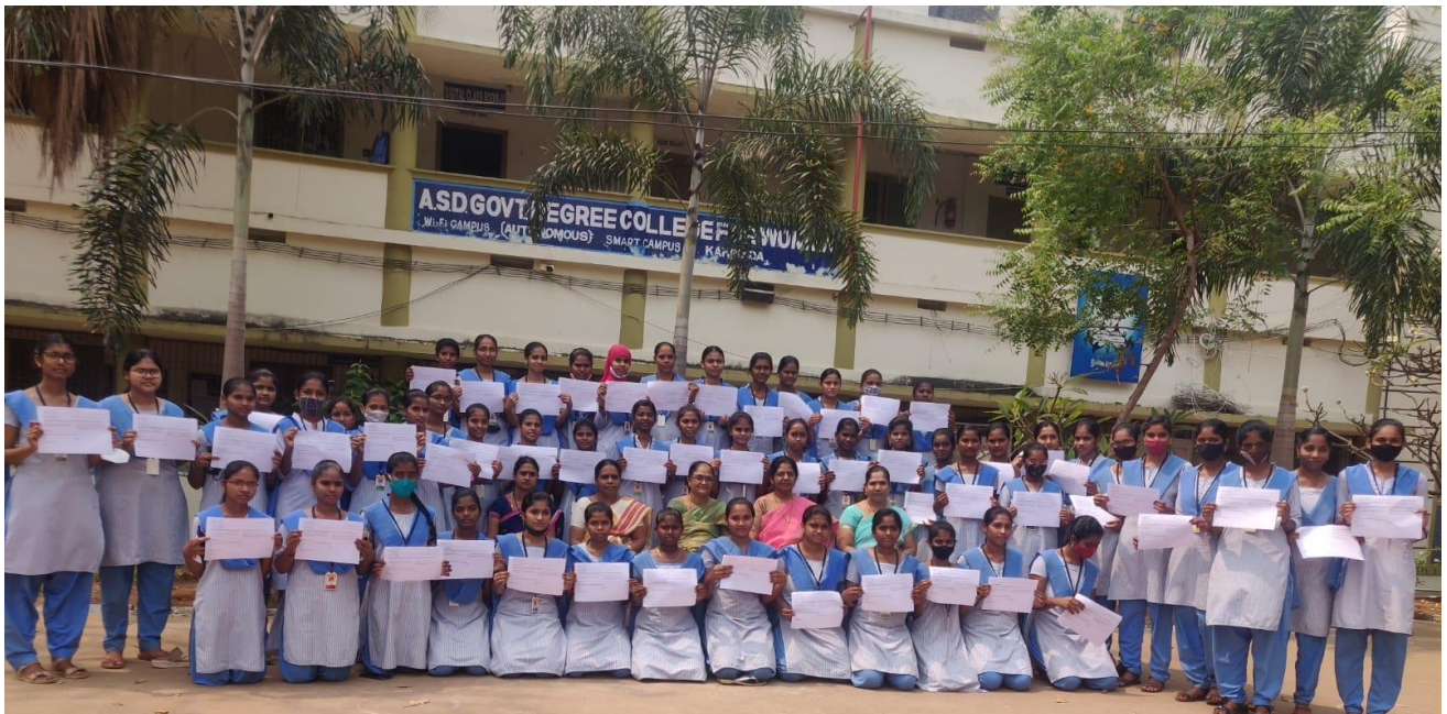
69 students from III B. Sc. (MPCs) and III B.Com. (CA) completed CCNA v7: Bridging Course through CISCO Networking Academy.