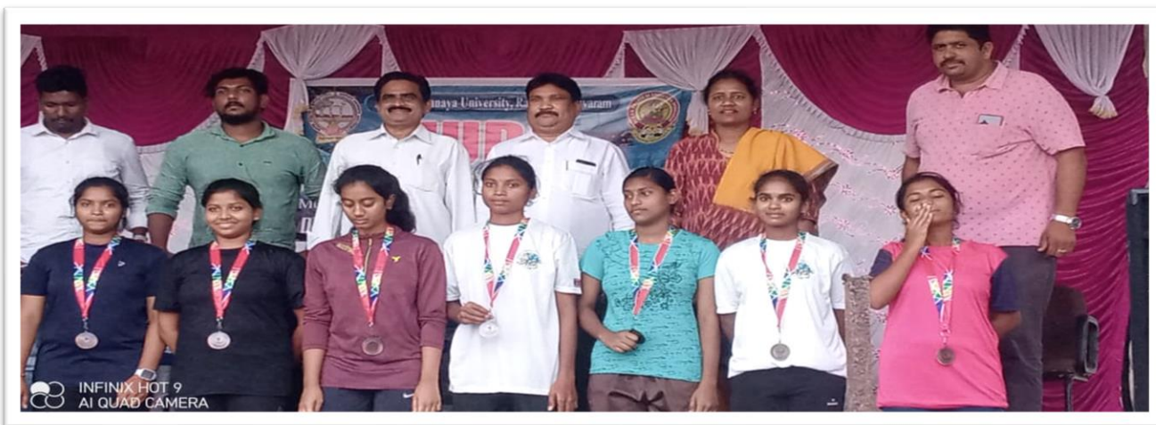
JUDO participant delegates with the organizing team