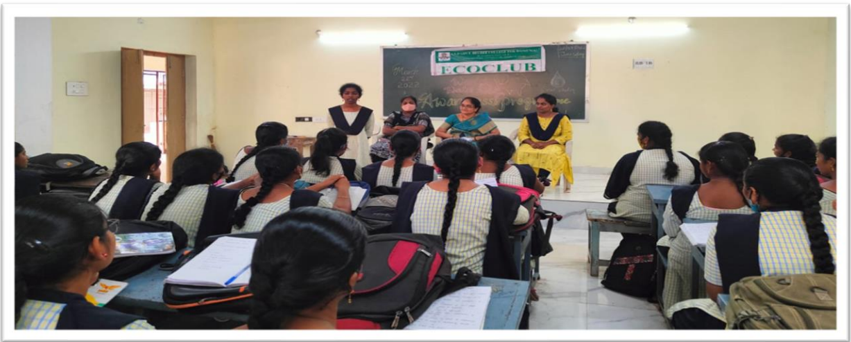
Eco-club organised Awareness Programme to Save Water in connection with World water day – 22/03/2022