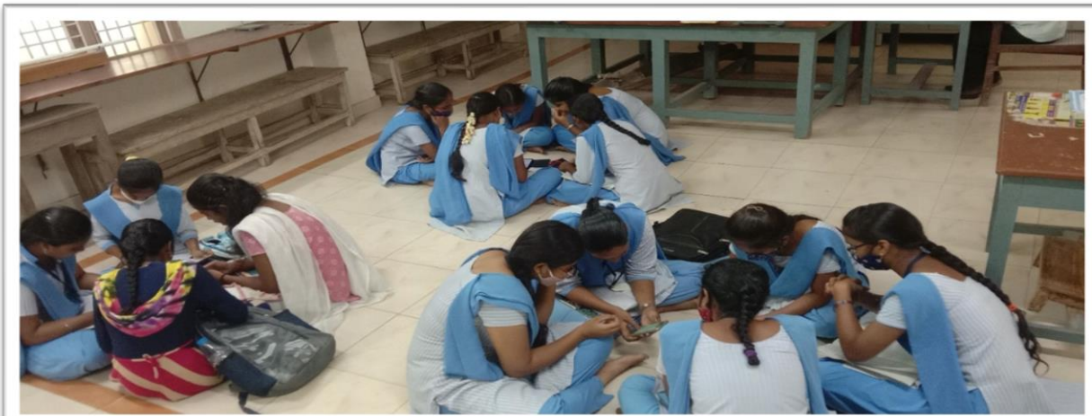
Students participating in Group Discussion conducted by the Department of Physics