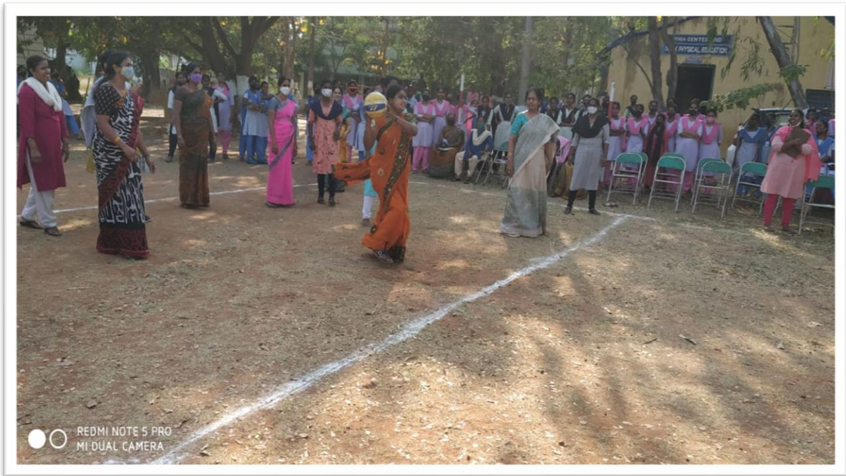
Throwball Match for Staff