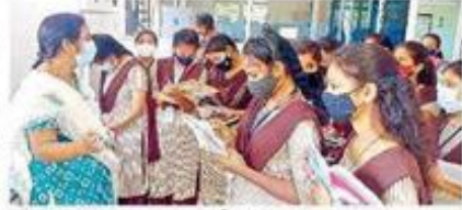
పాఠ్యాంశాలు వింటున్న పీఠ కళాశాల విద్యార్థులు

ద్వారా సూతన ఒకవదికి శ్రీధారం దుబ్బాయి. పది రోజులపాటు టెంట్ కళాశాలకు రెండు విద్యార్థులు మరొక కళాశాలలో విద్య నభ్యసించి వారిలోని నైపుణ్యాలను పేరుపెట్టిలా చేశాయి. తమకు తెలియని అంశాలను ఇతర కళాశాలలో ప్రయోగాత్మకంగా నేర్చుకుని తద్వారా