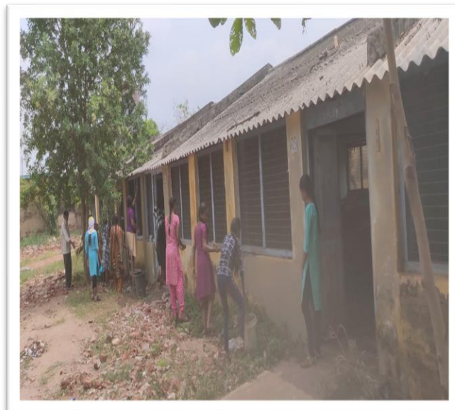
Cleaning and painting the college premises