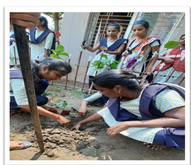
Planting 100 samples around the adopted area