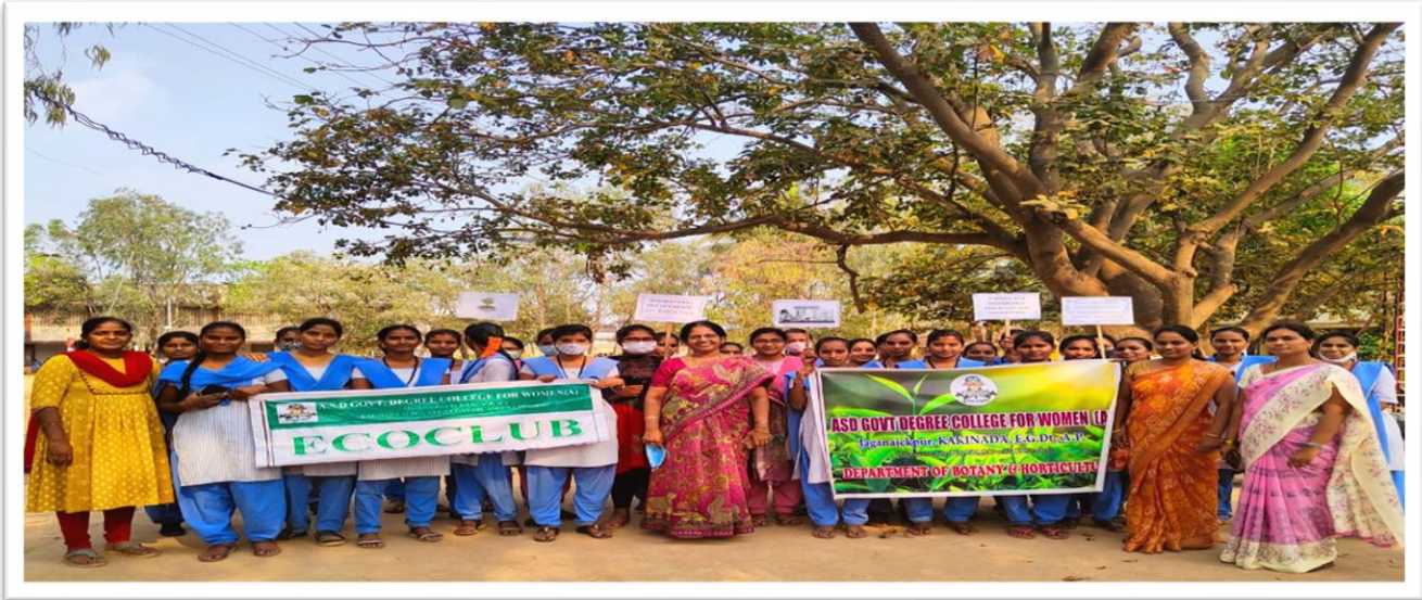
Departments of Botany and Horticulture and Eco-club jointly organised a Rally on account of International Forestry Day – 22/03/2022