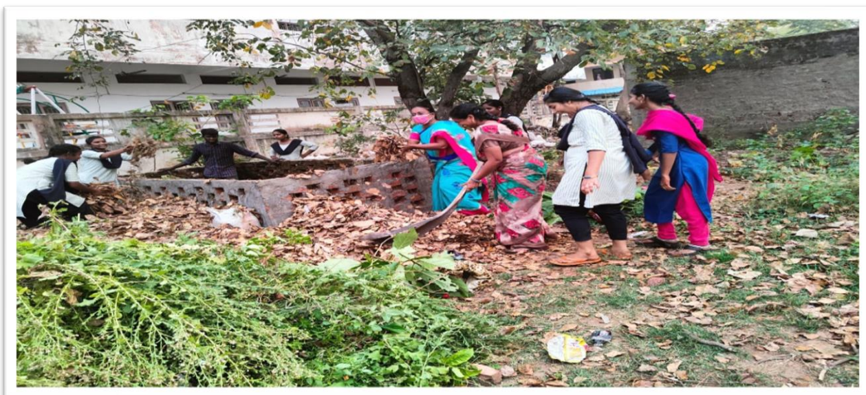
Staff & Students of the Departments of Botany & Horticulture took part in filling up of NADEP compost pit with dry & fresh leaf waste. – 23/03/2022