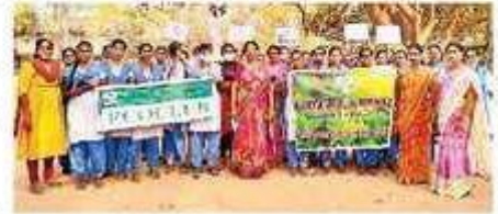
ర్యాలీ నిర్వహిస్తున్న అధ్యాపకులు, విద్యార్థినులు

సాంబ మూర్తినగర్: పెరుగుతున్న వాతావరణ కాలువ్యన్ని తగ్గించాలంటే ప్రతిఒక్కరూ