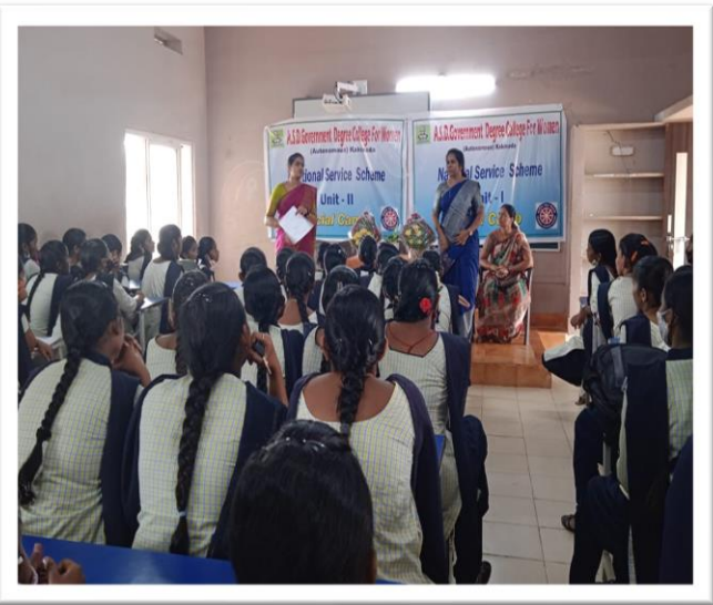
Principal, NSS I & II Coordinators giving instructions to accomplish their mission better