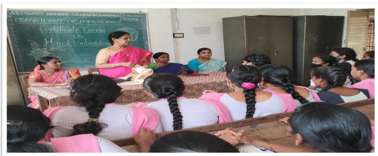
Inauguration of certificate course in Hand Embroidery by the department of Home Science – 17/03/2022