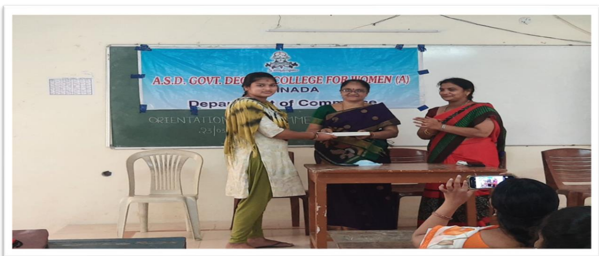
Orientation Course for M. Com Students and appreciating students of Outstanding performance on 23/03/2022