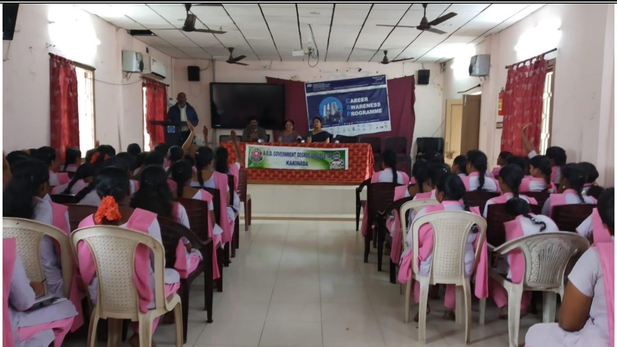
The Dept. of Commerce conducted Career Awareness Programme on CS Course by ICSI, VSKP on 21/11/2022. Caree