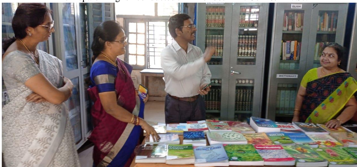
National Library Week Celebrations - The Book Exhibition at our College Library on 19/11/2022