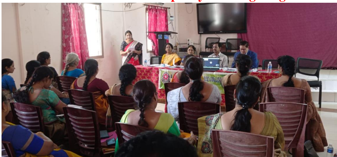
The 8 th Academic Council Meeting was held on 19 November 2022