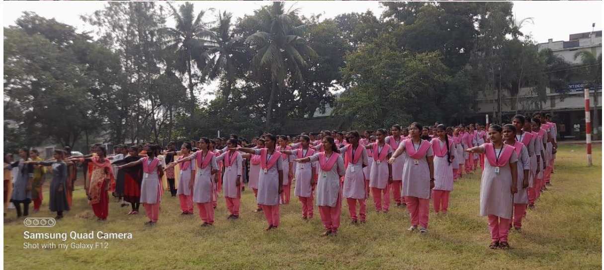
Giving prizes to the winners of the competitions and Taking Preamble Pledge as a part of the celebrations of the Constitution Day on 26/11/2022