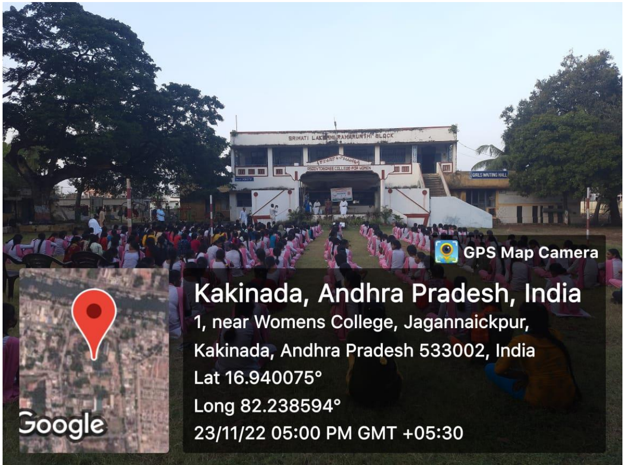
Yoga & Personality Development Time