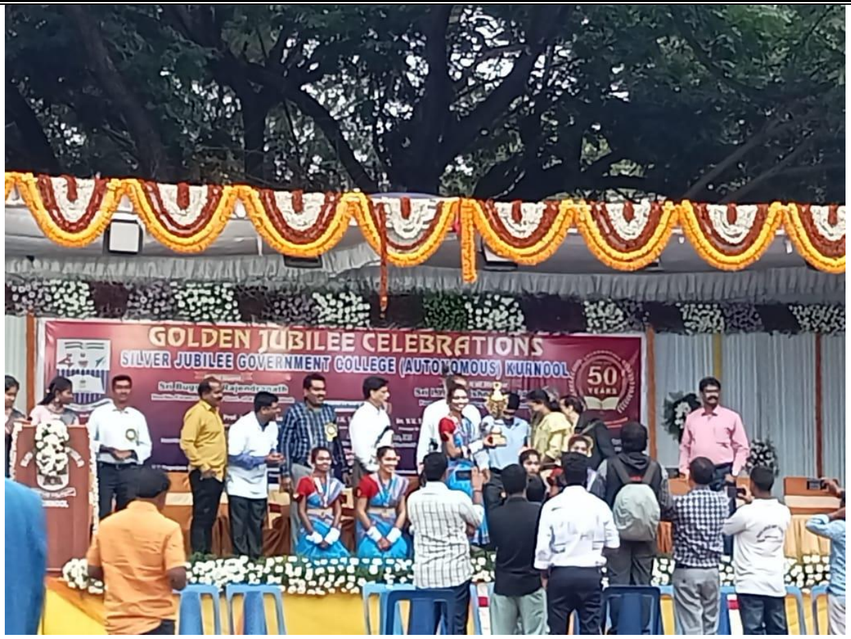
Dhimsa Dance Team is receiving the Cup as a token of appreciation for their wonderful performance.