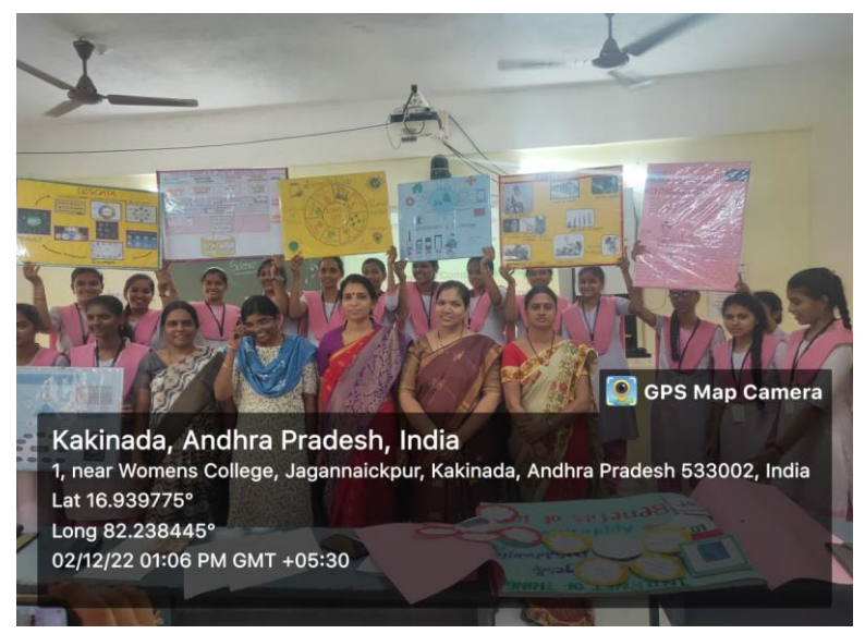
Students with their PP Displays

On account of World Computer Literacy Day, the Dept of Computer Science & Computer Applications organized Poster Presentations and Video Making Competitions on 02/12/2022.