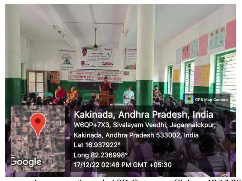
Consumer Awareness through ASD Consumer Club on 17/12/2022

The Department of Mathematics conducted a Quiz on "Differential Equations, General Mathematics, Identification of Mathematicians" for I Year students, "Group Theory & Analytical Skills" for II Year students of the mathematics stream, "Talent Test: Analytical Skills" for Non- Mathematics stream on 19/12/2022, and PPT and Poster Presentations on "Applications of Differential Equations" for I MPC & MPCS students, and "Applications of Mathematics" for II & III MPC & MPCS students on 20/12/2022.