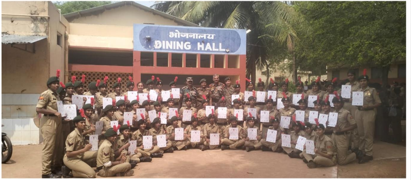
NCC cadets received their certificates at the camp.