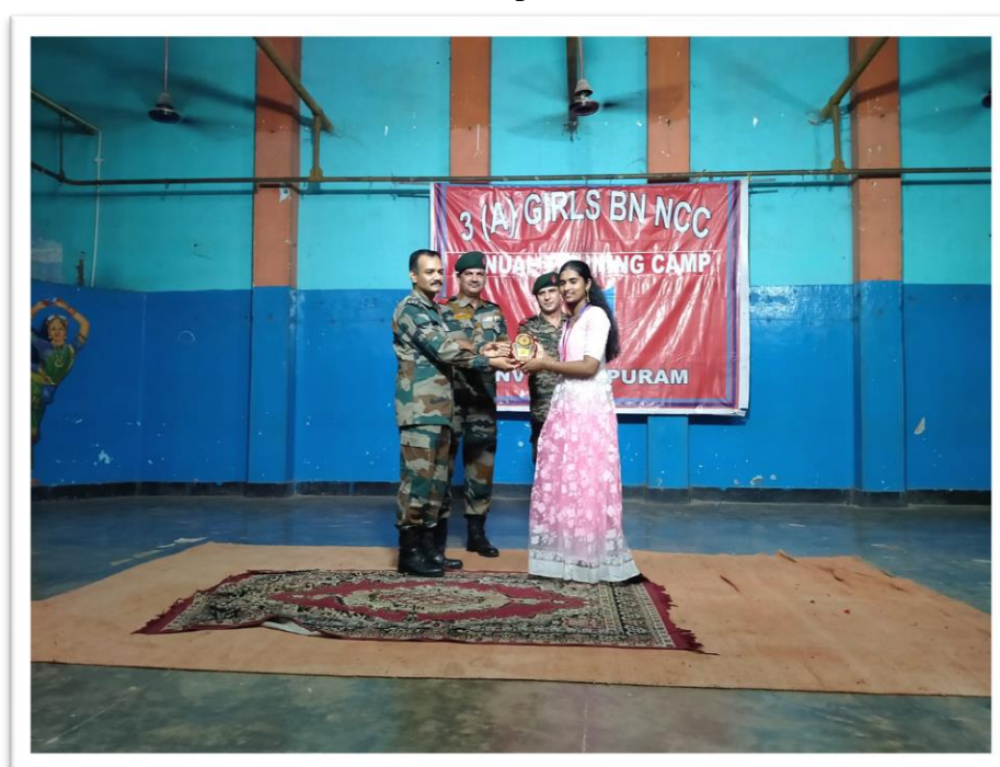
Receiving Senior Memento