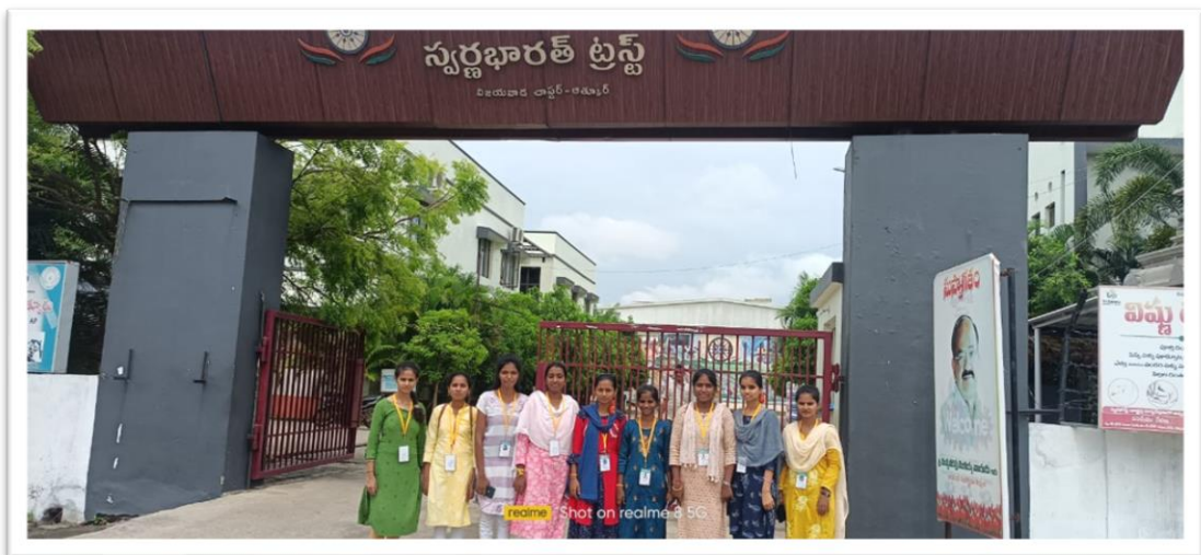
III MPC students at Swarna Bharat Trust for Internship