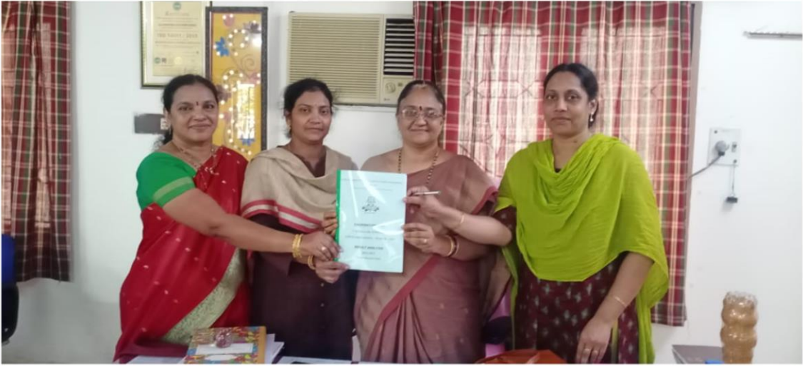
Released Regular V Semester End Exams Results on 12/05/2023