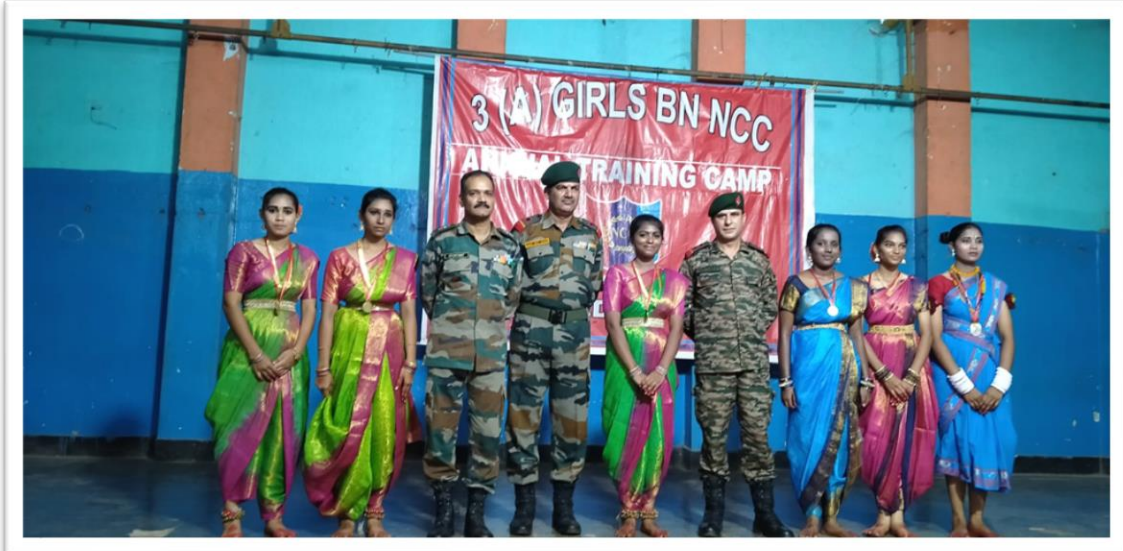
Prize Winners in Group Dance Performance