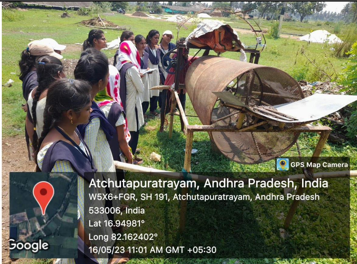
As a part of Internship III B. Sc. CBHT students visited Vermicompost Unit at Kadakudhuru and learned about its process