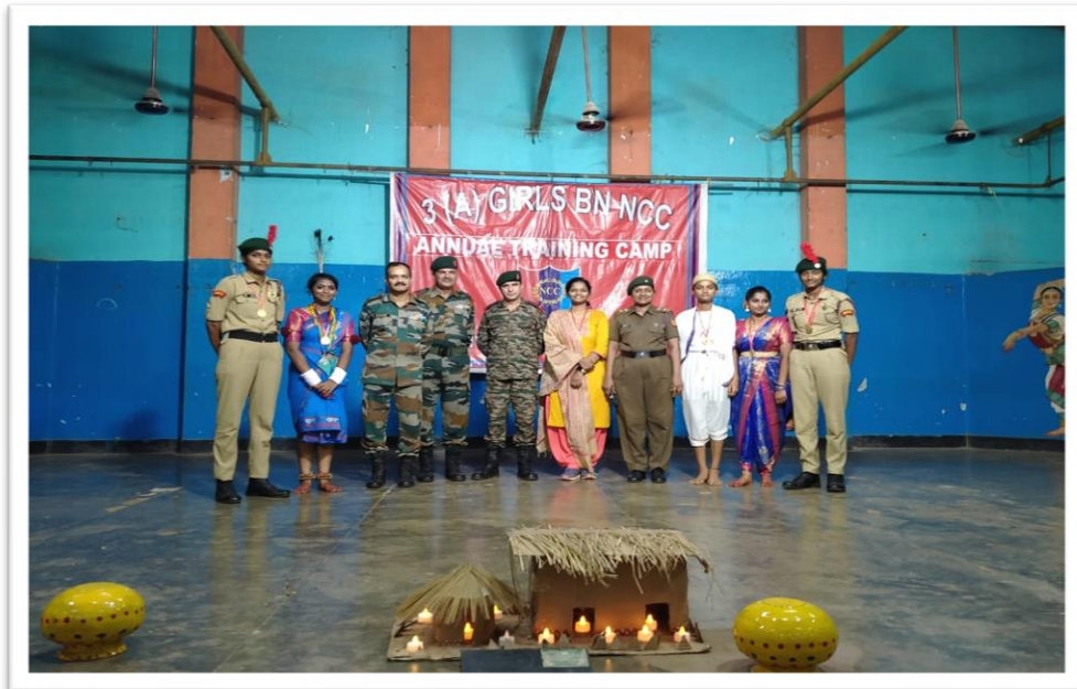
Guard of Honour and Pilots Gold Medals