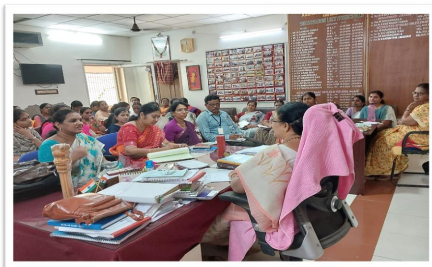
04/05/2023 - Staff Meeting