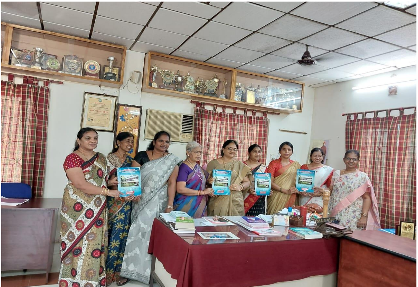
Magazine 2021-22 Print Form Release