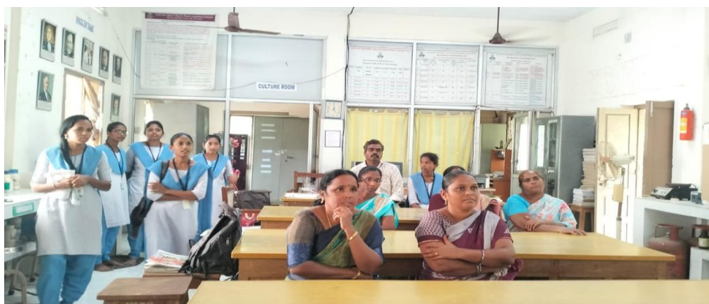
Parents of III CBMB students