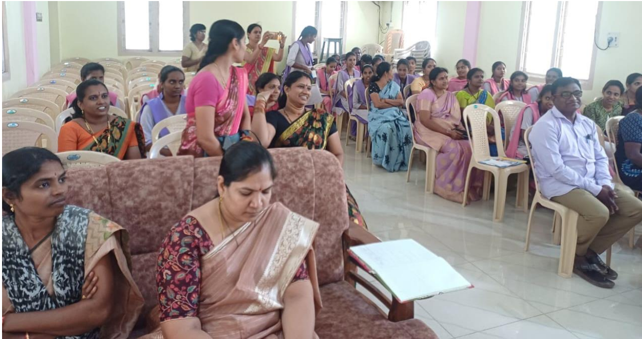
Parents interacting with the faculty members